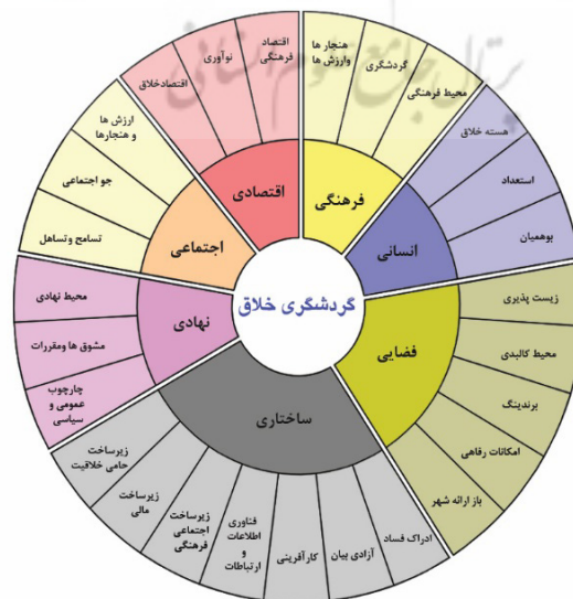
شکل ۳: الگوی گردشگری خلاق مبتنی بر رویکرد بازآفرینی فرهنگ‌محور

در ادامه، با مقایسه مفاهیم گوناگون، به این نتیجه رسیدیم که مفاهیم الگوی بازآفرینی فرهنگ‌محور، که در