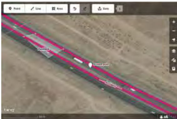
شکل ۶: خط و نقطه و سطح ایجاد شده در OSM به منظور ثبت تصادف فرضی

در شکل ۶ نیز خط ایجاد شده به همراه نقطه و سطح ایجاد شده برای تصادف نمایش داده شده است. براساس نتایج این تحقیق به منظور بررسی دقیقتر، یک ارزیابی کیفی بر مبنای قابلیت ویرایشگرهای مختلف OSM در ثبت داده‌های تصادفات انجام گرفت. در جدول ۲ قابلیت ویرایشگرهای OSM به صورت کیفی و بر اساس معیارهای مختلفی همچون ایجاد اطلاعات به صورت خط، نقطه و پلیگون، کاربر پسند بودن، قابلیت استفاده به صورت آفلاین و سطح تخصص، اطلاعات پیش فرض توصیفی و غیره مورد ارزیابی قرار گرفت.