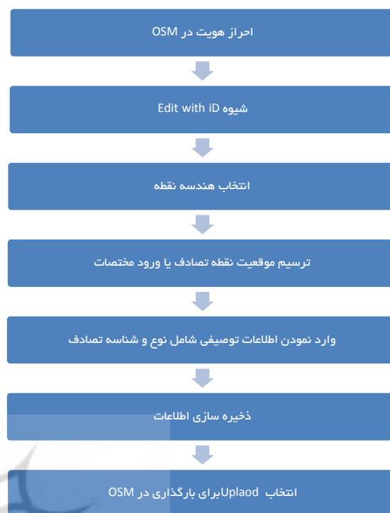
شکل ۳: مراحل ایجاد نقطه تصادف در OSM

کاربر در نهایت تغییرات را ذخیره می‌نماید. با انتخاب این گزینه خط مورد نظر به عنوان خط مربوط به تصادف بارگذاری می‌گردد. در نمودار شکل ۴ مراحل ایجاد خط تصادف در OSM نمایش داده شده است. سومین عارضه مورد استفاده در داده‌های برداری سطح می‌باشد. سطوح می‌توانند دارای اطلاعات بیشتری از محل وقوع حادثه باشند. اگر دقت کاربر در ثبت تصادف در یک مقیاس دقیقتر امکانپذیر باشد، پیشنهاد می‌شود که محدوده تصادف به صورت عارضه سطحی ثبت شود. از سوی دیگر برخی تصادفات محدود به یک امتداد حمل و نقل نمی‌شوند. مثلاً حالتی را تصور کنید که در یک بزرگراه چهارباند یک تصادف می‌تواند سه باند عبور و مرور را مسدود نماید. و یا حالت پیچیده تری که اتومبیل گاردریل را در مسیر مستقیم رد کرده و وارد باند مسیر معکوس می‌شود.