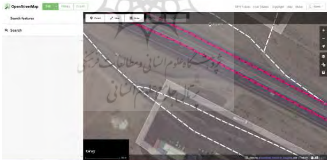
شکل ۲: صفحه نمایش داده شده در OSM پس از انتخاب گزینه اول Edit

امکان دیگر ثبت اطلاعات مکانی تصادف به صورت عارضه خطی می‌باشد. عوارض خطی دومین نوع عوارض برداری می‌باشند که در مورد عوارض خطی‌ای مانند راه، راه آهن، خطوط انتقال آب، برق و گاز و غیره کاربرد دارند. نقاط ساده‌ترین عارضه برای نمایش موقعیت تصادفات بودند، اما در صورتی که کاربر