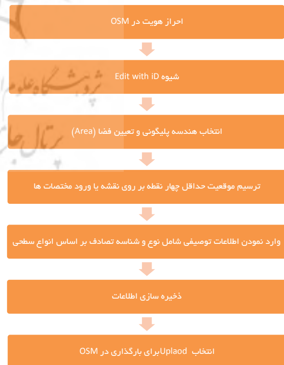
شکل ۵: مراحل ایجاد خط تصادف در OSM

در این خصوص نیز آخرین گزینه که همان Area می‌باشد انتخاب می‌گردد و اصطلاح Car Accident به عنوان نام ناحیه مورد نظر انتخاب می‌شود. با ذخیره سازی، اطلاعات بر روی OSM بارگذاری می‌گردند. در نمودار شکل ۵ روند ایجاد سطح نمایش داده شده است.