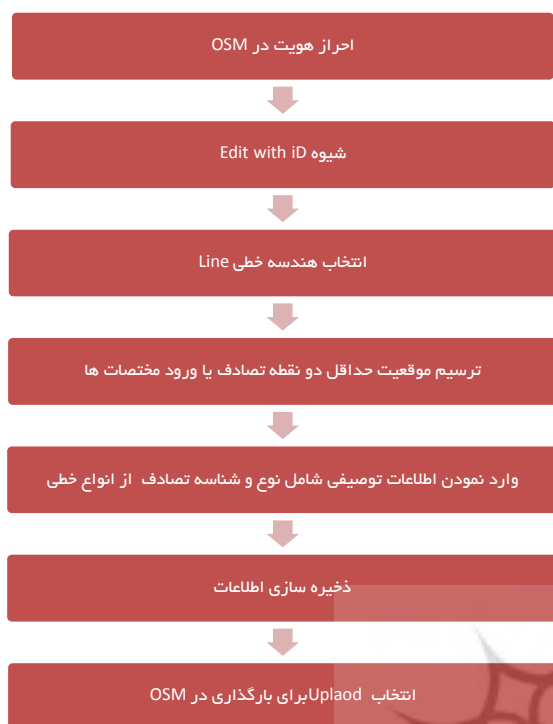
شکل ۴: مراحل ایجاد خط تصادف در OSM