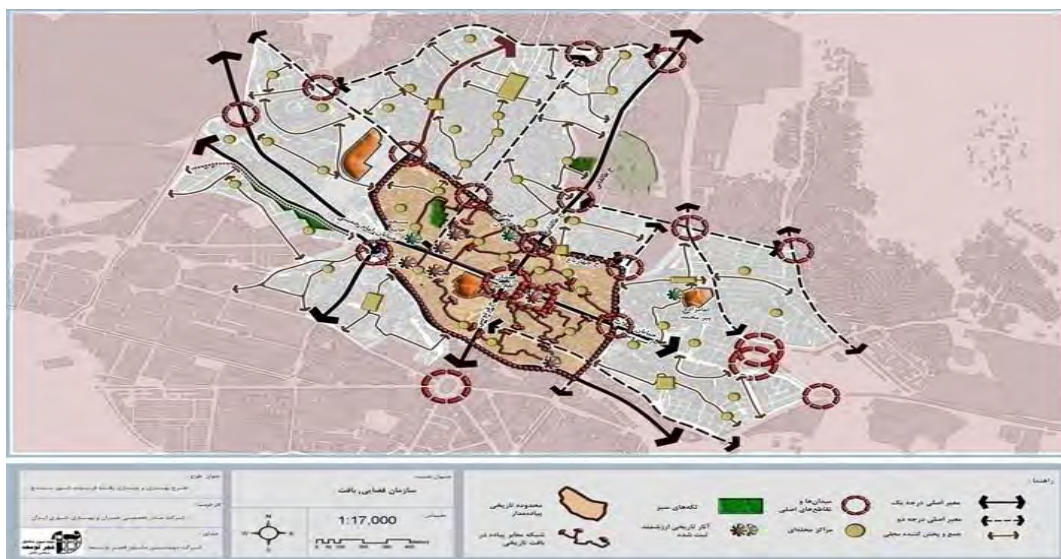
شکل ۳. ساختار فضایی محدوده مورد مطالعه