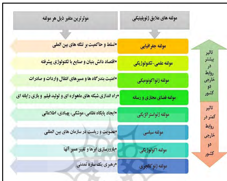
شکل شماره ۲- میزان تاثیرگذاری مولفه‌ها و متغیرهای علائق ژئوپلیتیکی ترسیم از نگارندگان

بالاترین رتبه‌ها را به خود اختصاص داده‌اند. از سوی دیگر مولفه‌های ژئوکالچری، اکولوژیکی و سیاسی تاثیر کمتری نسبت به سایر مولفه‌ها داشته‌اند.