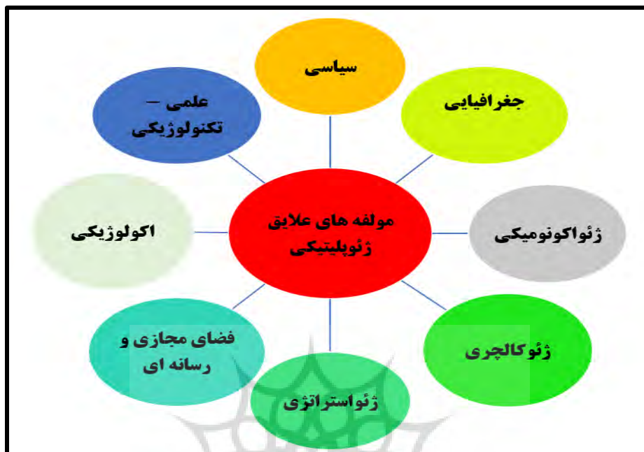
شکل شماره ۱: ابعاد هشت گانه علایق ژئوپلیتیک ترسیم از نگارنده.

اکولوژیکی و فضای مجازی و رسانه‌ای هم پرداخته شود؛ تا بتوان الگوی جهان شمولی را برای علایق ژئوپلیتیک ترسیم کرد.