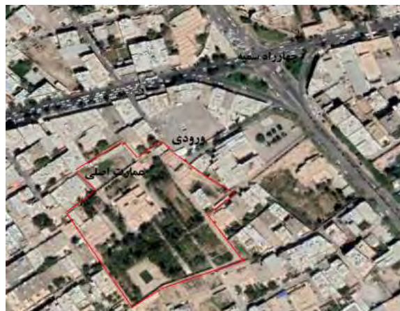
شکل ۵. تصویر ماهواره‌ای باغ موزه هرندی