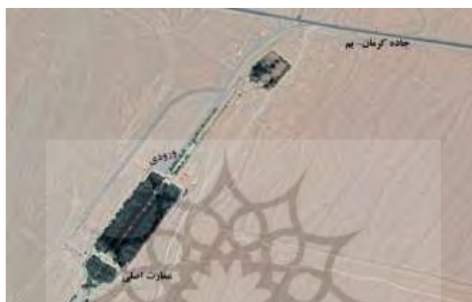
شکل ۴. تصویر ماهواره‌ای باغ شاهزاده ماهان

باغ شاهزاده ماهان (ثبت جهانی یونسکو) در شهرستان کرمان قرار دارد. شکل کلی باغ با محور مرکزی، آبشارها، پیاده‌روها، و ردیف متناوب درختان چنار و سرو، و کرت‌های جانبی میوه دید بیننده را به بنای سفید بالاخانه در متن کوه‌ها متوجه می‌سازد (نیلی و همکاران، ۱۳۹۲: ۱۷۳). درختان غالب این باغ سرو، چنار، و سپیدار است. از مهم‌ترین ویژگی‌های این باغ این است که به صورت پله‌ای ساخته شده است و باعث به وجود آمدن آبشارهایی در مسیر اصلی شده است. بنای این باغ به دوره قاجار نسبت داده می‌شود. نزدیکی به عمارت شتر گلو، آرامگاه شاه نعمت‌الله ولی، و خوش آب و هوا بودن منطقه از محاسن این باغ تاریخی محسوب می‌شود.