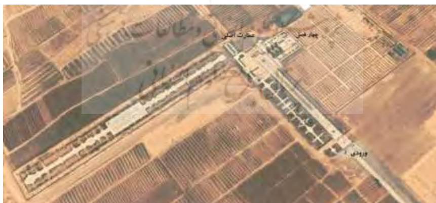
شکل ۶. تصویر ماهواره‌ای باغ فتح‌آباد کرمان

در حاشیه شهر اختیارآباد در ۱۳ کیلومتری شمال غرب کرمان واقع شده و توسط قنات فتح‌آباد آبیاری می‌شده است. هسته اولیه عمارت‌های باغ در حدود ۱۲۸۰ ق توسط حسین‌علی‌خان فرزند فضل‌علی‌خان شکل می‌گیرد و متأثر از محیط بکر و مستعد پیرامون خود روزبه‌روز شکوفاتر می‌شود و عمارت‌های چندی بدان افزوده می‌شود. در جانب شرق عمارت اصلی عمارت چهارفصل است که به لحاظ ساختار قرابت‌های فراوانی با کوشک باغ ایرانی دارد. این عمارت در یک اشکوب و برون‌گرا بوده و از چهار سو به محیط پیرامون خود دید دارد. نحوه قرارگیری عمارت چهار فصل به همراه شش اصله درخت کاج و آب‌نمای آن سبب ایجاد محوری جدید عمود بر محور اصلی شده است. باغ در طول سال دارای تنوع عملکردی کم‌نظیری بوده؛ به‌گونه‌ای که می‌توان آن را باغ حکومتی، سکونتی، تشریفاتی، یا تولیدی دانست (سلطان‌زاده و اشرف گنجویی، ۱۳۹۲). بسیاری از محققان این باغ را الگوی ساخت باغ شازده ماهان می‌دانند و پس از مرمت در سال ۱۳۹۴ برای بازدید عموم بازگردید. ابعاد تقریبی این باغ ۲۵۰ در ۴۵۰ متر است.