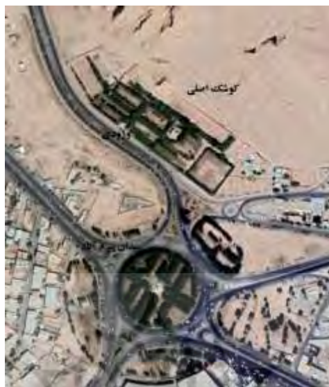
شکل ۷. تصویر ماهواره‌ای باغ بیرم‌آباد

قالب یک سیستم هندسی مبتنی بر دو محور متعامد مکان‌یابی شده‌اند. عمارتی که درارای دو اشکوب است و ما آن را عمارت اصلی می‌نامیم در انتهای محوری که ورودی نقطه آغاز آن است قرار گرفته و عمارتی که به دلیل پلان هشت‌ضلعی‌اش آن را گوشه هشت‌ضلعی می‌نامیم (سلطان‌زاده و اشرف گنجوی، ۱۳۹۲: ۸۰). نزدیکی به تخت درگاه قلی‌بیگ، گنبد جبلیه، و همچنین پارک جنگلی پردیسان بر اهمیت این باغ افزوده است.