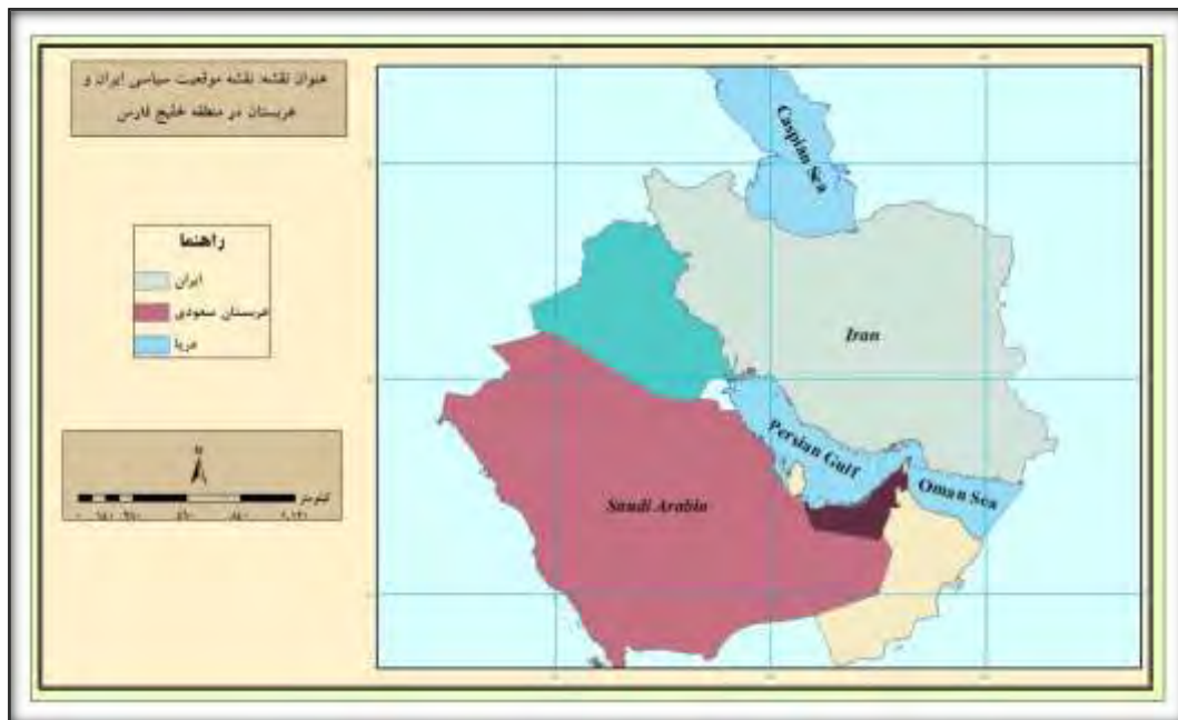
نقشه ۱. نقشه موقعیت ایران و عربستان در منطقه خلیج فارس