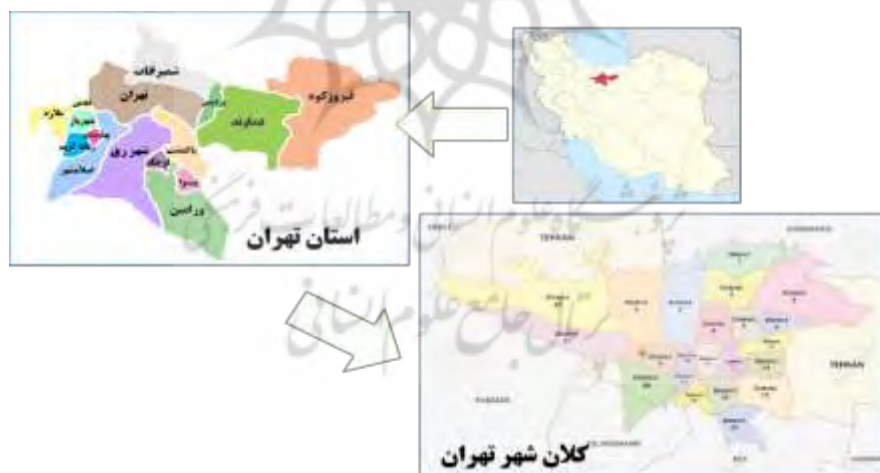
شکل ۲. موقعیت کلان‌شهر تهران