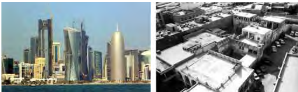
تصویر ۲. تحول دوحه از وضعیت سنتی به وضعیت معاصر

ذکر این نکته لازم است که از آنجا که هسته اصلی مقاله حاضر بر مقوله فضا و قدرت در اقتصاد و دولت رانتهی استوار است، ضروری است به چند پژوهش که در این زمینه انجام پذیرفته است نیز اشاره کرد تا با استخراج شکاف آن‌ها در راستای تقویت پژوهش قدم برداشت: