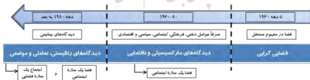
شکل ۱. سیر تطور مفهوم فضا طی دهه‌های اخیر

موضوع فضا و فضای شهری همواره از بحث‌های اصلی مجامع علمی معماری و شهرسازی بوده است و مفهوم آن در طول تاریخ تفکر اجتماعی و در قالب مکاتب تئوری کلاسیک و نو شکل گرفته است (نوربرگ شولتز، ۱۳۵۳: ۵۰). در حیطه فلسفی‌شناسی فضا سه دیدگاه عمده ارائه شده است که در شکل ۱ قابل ملاحظه است (نقل مفهوم از افروغ، ۱۳۷۶: ۲۹).