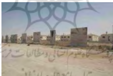
تصویر ۱. محله دروازه‌ای آندولوس در بزرگراه فرودگاه

شهر امان پایتخت کشور اردن، نمونه بارز بازساخت فضایی نئولیبرالیستی است که فرم‌های تولیدشده حاصل فرایند مهندسی و آرایش فضاهاست، همچون برج‌های تجاری که مفاهیمی چون فضاهای انحصاری سکونت و مصرف (همچون اردن گیت ۴ ، عبدالعلی ۵ )، تعدد محلات دروازه‌ای در سرتاسر شهر (همچون گرین لند ۶ و آندولوس ۷ ) و محلات فقیرنشین (همچون جیزا ۸ ، مارکا ۹ ، و صحاب ۱۰ ) را عرضه می‌نماید که سعی در خروج بخش‌های فقیرنشین از محدوده شهر به مناطق جدید شهری و متعاقباً شکل‌گیری هتروپلیاس است (داهر، ۲۰۱۳).