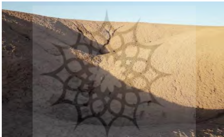
شکل ۵: سازند قرمز بالایی هوازده در منطقه مطالعاتی