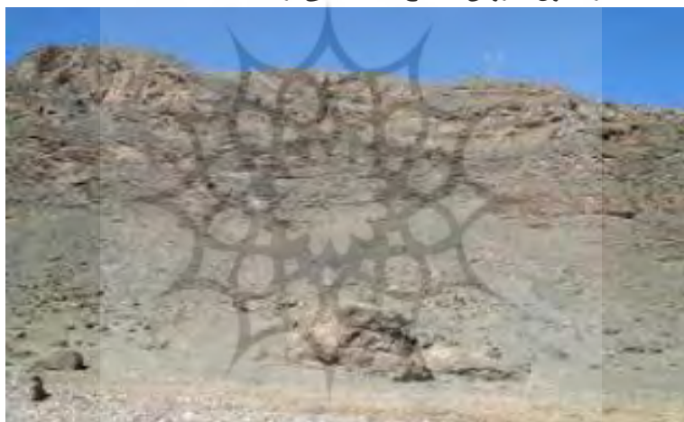
شکل ۲: سازند قم در منطقه مطالعاتی

مقایسه می‌شود سپس میزان تغییر رنگ تعیین شده بررسی می‌شود (دهداری فر و همکاران، ۱۳۹۹، ۵۹۸). به منظور اندازه‌گیری فواصل درزه از خط‌کش استفاده شد و فاصله بین دو درزه متوالی برآورد گردید. عرض درزه‌ها نیز با استفاده از خط‌کش تعیین گردید. براساس این که درزه‌ها جهت‌یافته‌اند یا خیر و شیب آن‌ها نسبت به شیب دامنه به چه صورت می‌باشد، امتیازدهی داده شد. پیوستگی درزه‌ها با بررسی امتداد درزه‌ها و مقدار پرشدگی مشخص و بر این اساس امتیازدهی شد. هم‌چنین وضعیت پوشش گیاهی بر روی دامنه سازندی براساس انبوه پوشش گیاهی در ۱۰۰ متر مربع دسته‌بندی شد و نمونه‌برداری به روش تصادفی سیستماتیک انجام شد. از آنجایی که فاکتور پوشش گیاهی به سبب نقش مثبت در مقاومت سازندها از اهمیت بسزایی برخوردار است لذا ۵-۰ بوته در ۱۰۰ متر مربع در طبقه خیلی حساس، ۱۰-۵ بوته در ۱۰۰ متر مربع در طبقه حساس، ۱۵-۱۰ بوته در ۱۰۰ متر مربع در طبقه متوسط، ۲۰-۱۵ بوته در ۱۰۰ متر مربع در طبقه نسبتاً مقاوم و ۲۵-۲۰ بوته در ۱۰۰ متر مربع در طبقه مقاوم قرار گرفته شد. تحلیل نتایج نیز به کمک آنالیز واریانس و آزمون مقایسه میانگین‌های چند دامنه‌ای دانکن و استنباط آماری نتایج انجام گرفت. در نهایت نیز تحلیل نتایج و مقایسه وضعیت تخریب‌پذیری واحدهای سازندی و انطباق نتایج با شواهد ژئومورفولوژی دامنه‌ها صورت گرفت و فاکتور پوشش گیاهی به عوامل مدل سلبی اضافه شد. در جدول ۱، روش اصلاح یافته سلبی ارائه شده است.