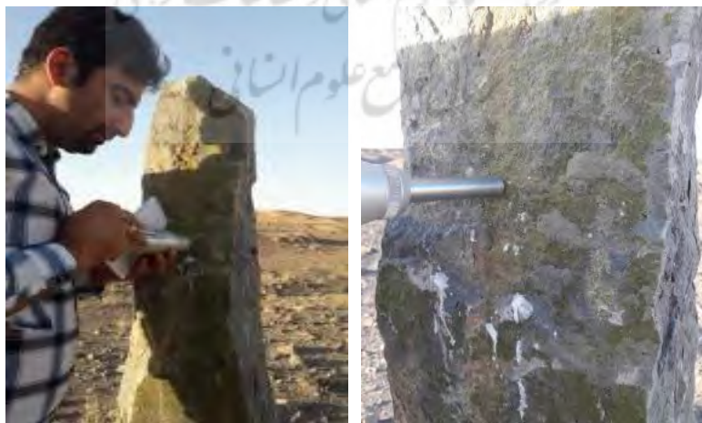
شکل ۶: تصاویری از نحوه نمونه برداری