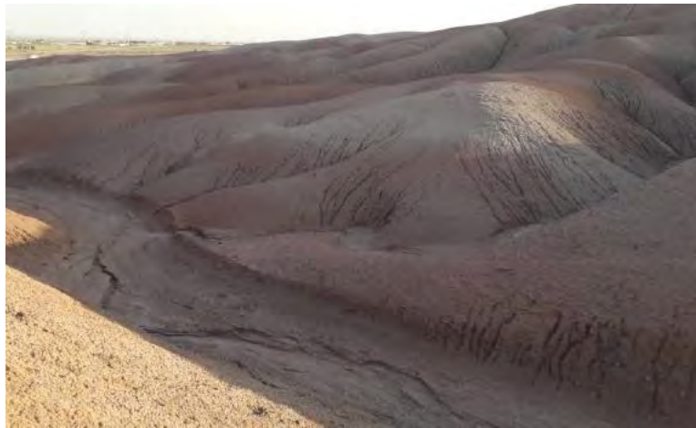
شکل ۴: سازند قرمز بالایی در منطقه مطالعاتی