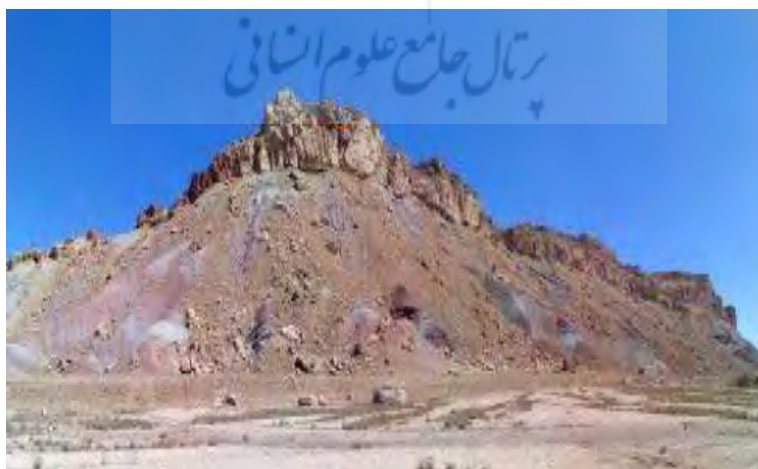
شکل ۳: سازند قرمز زرین در منطقه مطالعاتی