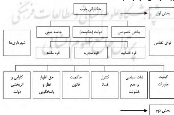
شکل ۱- مدل مفهومی شاخص های حکمروایی خوب شهری

در نهایت، براساس تحلیل یافته های نظری، مهم ترین شاخص های حکمروایی خوب براساس ویژگی های ساختاری- کارکردی شهرهای ایران بویژه شهر کرج، مهم ترین شاخص های حکمروایی خوب به شرح مدل مفهومی زیر است.