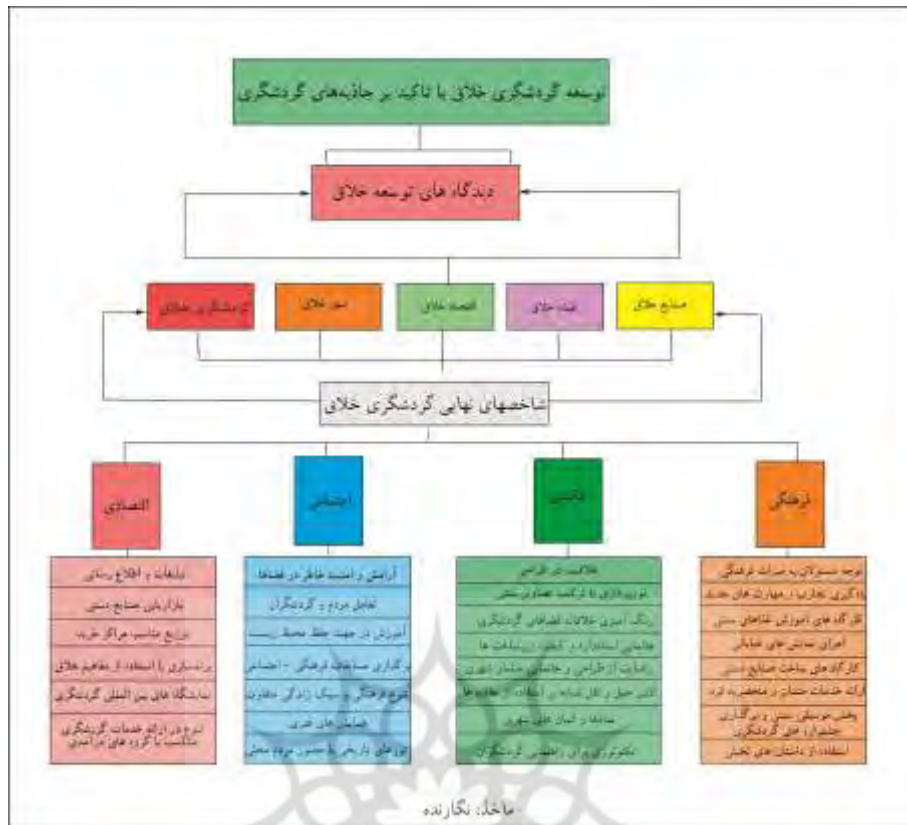
شکل ۱: مدل مفهومی پژوهش