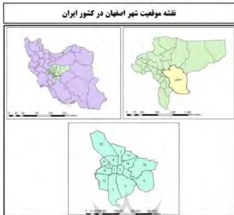
شکل ۲: موقعیت شهر اصفهان