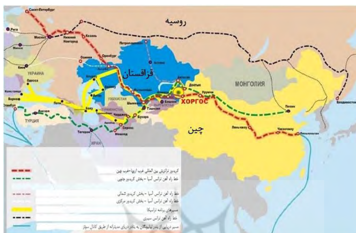
شکل (۲): خطوط ریلی عبوری از قزاقستان از بندر خورگاس

انتقال کالا از چین به اروپا از طریق دریاها حدود هفت هفته و یا حتی بیشتر طول می‌کشد، اما از مسیر زمینی قزاقستان، این زمان به ۱۲ تا ۱۵ روز کاهش پیدا می‌کند البته هزینه آن از مسیرهای دریایی بیشتر است. اما سرعت انتقال کالا را افزایش می‌دهد و از مسیر هوایی بسیار ارزاتر است، برای برخی از شرکت‌های چینی، بویژه شرکت‌هایی که کالاهای با ارزش افزوده بالا تولید می‌کنند صرفه اقتصادی دارد. همکاری چین و قزاقستان در منطقه ویژه اقتصادی خورگاس ۱ که در دو سوی مرز چین و قزاقستان واقع شده، یکی از نمادهای مهم همکاری‌های حمل و نقلی رو به گسترش میان چین و کشورهای آسیای مرکزی به شمار می‌آید. شرکت‌های چینی حدود ۲۴ درصد از سهام این بندر خشک و منطقه ویژه اقتصادی خورگاس را بدست آورده‌اند. چین یکی از سرمایه‌گذاران و همکاران فنی مهم در پروژه کلان راه‌آهن ترانس قزاقستان است. البته بخش مهمی از سرمایه‌گذاری‌ها در زمینه زیرساخت‌های حمل و نقلی و بویژه پروژه کلان راه‌آهن ترانس قزاقستان از سوی دولت این کشور صورت گرفته است. بر مبنای آمارهای ارائه شده توسط