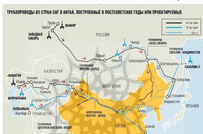
شکل (۱): خطوط نفت و گاز به چین از مبدأ یا از طریق قزاقستان

نخستین خط لوله نفت فراملی در چین است. این خط لوله در اتیرائو ۱ در سواحل دریای خزر آغاز می‌شود، از کنکیاک ۲ ، قوم‌کول ۳ و اتاسو ۴ عبور می‌کند، از طریق مرز آلاشانکو ۵ وارد چین می‌شود و به دوشانزی ۶ می‌رسد، جایی که بزرگ‌ترین پایگاه پتروشیمی در غرب چین فعالیت می‌کند (kz.china-embassy, 2018).