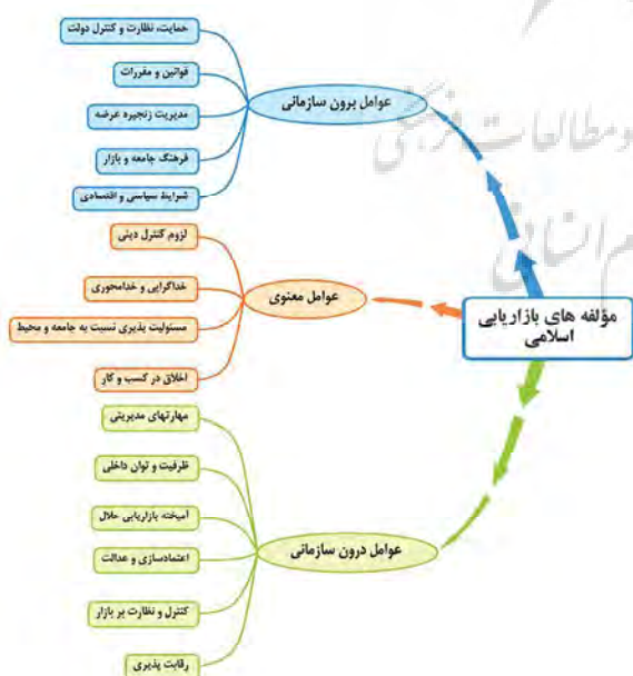
نمودار ۱- نقشه ذهنی متغیرهای بازاریابی اسلامی