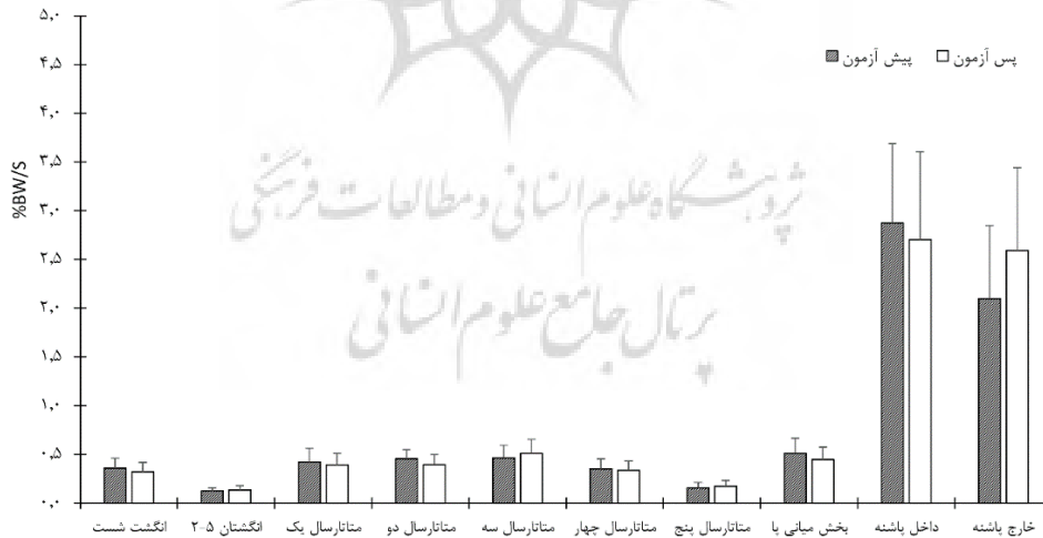
شکل ۴- مقایسه متغیر نرخ بارگذاری در نواحی ده گانه پا

شکل شماره ۴ نرخ بارگذاری را قبل و بعد از ماساژ نشان می دهد.