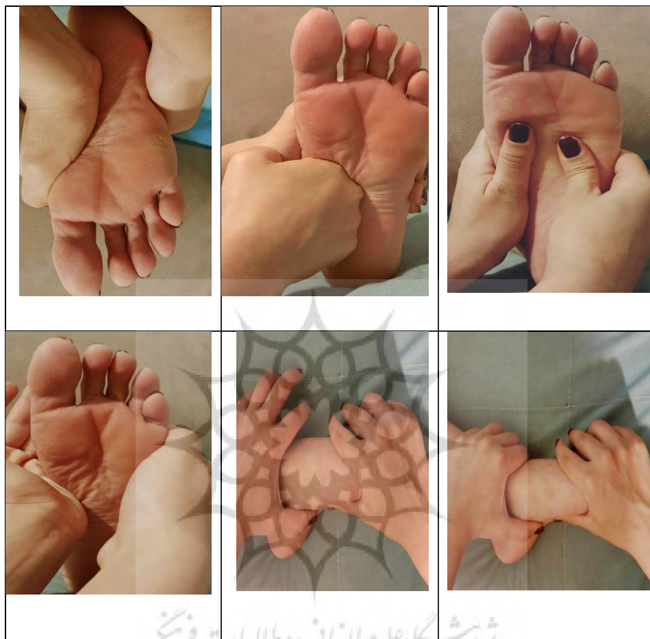
شکل ۱- ماساژ کف پا

برای بررسی نرمال بودن توزیع داده‌ها از آزمون شاپیروویلک و برای مقایسه متغیرهای وابسته در قبل و بعد ماساژ کف پایی از آزمون آماری تی وابسته استفاده شد. سطح معناداری در تمامی آزمون‌های آماری ۰/۰۵ در نظر گرفته شد.