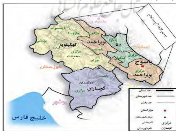
شکل ۱: موقعیت جغرافیایی شهرستان بویراحمد در استان کهگیلویه و بویراحمد

محدوده‌ی مورد مطالعه، شهرستان بویراحمد یکی از شهرستان‌های جنوبی ایران بود که در استان کهگیلویه و بویراحمد قرار گرفته است. این شهرستان بین استان‌های فارس، اصفهان، چهارمحال و بختیاری و شهرستان‌های دنا، کهگیلویه، چرام و باشت قرار دارد (شکل ۱). مرکز این شهرستان شهر یاسوج است، که در مختصات جغرافیایی ۵۱ درجه و ۳۶ دقیقه طول شرقی و ۳۰ درجه و ۴۰ دقیقه عرض شمالی و ارتفاع ۱۸۷۰ متری از سطح دریا قرار دارد. جمعیت این شهرستان بر طبق سرشماری سال ۱۳۹۰، برابر با ۲۴۳۷۷۱ نفر بوده است که حدود ۱۲۲۴۸۰ هزار نفر در مناطق شهری ساکن هستند و بقیه را جمعیت روستایی و عشایری تشکیل می‌دهند. این شهرستان دارای ۵ بخش (مرکزی، سپیدار، کبگیان، لوداب و مارگون) و ۱۱ دهستان (دشتروم، سررود جنوبی، سررود شمالی و کاکان (بخش مرکزی) سپیدار مرکزی (سپیدار) و چیتاپ و دم چنار (کبگیان)، چین و لوداب (لوداب)، مارگون و زیلابی (مارگون) می‌باشد (استانداری کهگیلویه و بویراحمد، ۱۳۹۰). در شهرستان بویراحمد پنج روستای گردشگری وجود دارد که در این پژوهش مورد توجه قرار گرفته‌اند. این روستاها عبارتند از: روستای دهنو، شهینز، تنگ تامرادی، مختار، و منصورخانی کاکان (سازمان میراث فرهنگی، صنایع دستی و گردشگری استان کهگیلویه و بویراحمد، ۱۳۹۵).