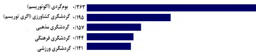
شکل ۴: انتخاب مناسب‌ترین سیستم گردشگری