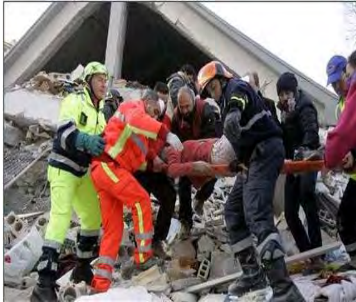
تصویر ۳: امدادگران در حال عملیات نجات