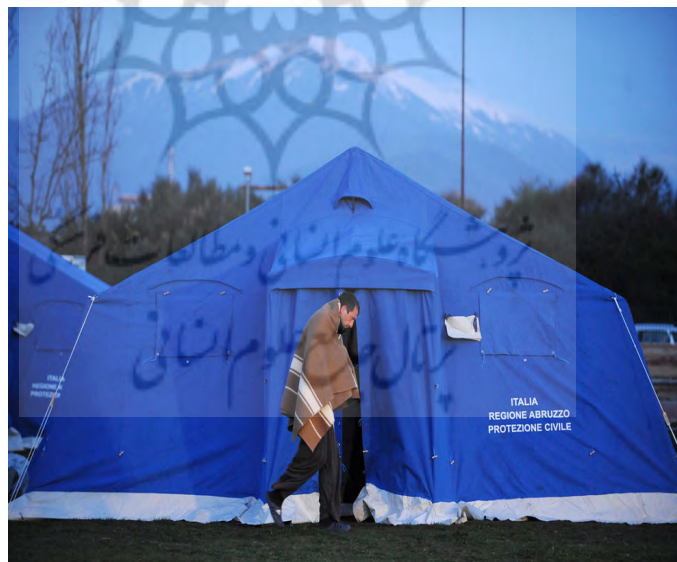
تصویر ۴: اسکان اضطراری مهیا شده توسط سازمان دفاع غیر نظامی ایتالیا