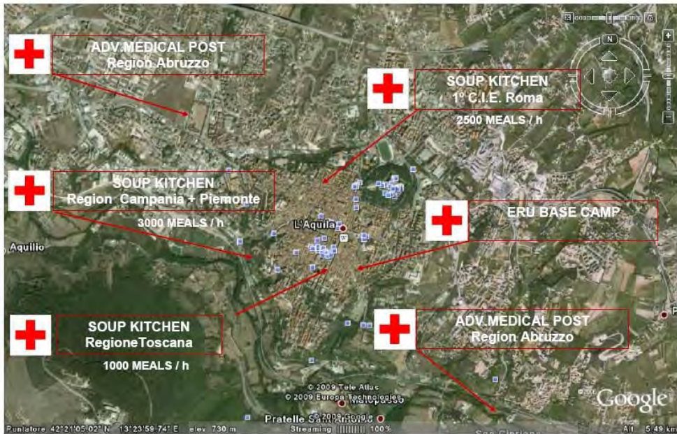
تصویر ۵: محل استقرار پست های درمانی صلیب سرخ ایتالیا