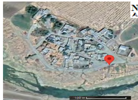
شکل ۱. موقعیت و نقشه سرآسیاب موسی در حاشیه کلان شهر کرمانشاه

گازرسانی، روستای سرآسیاب موسی در حاشیه کلان شهر کرمانشاه انتخاب شده است. روستای سرآسیاب موسی با جمعیت ۱۲۰ نفر، از توابع بخش مرکزی شهرستان کرمانشاه است. استان کرمانشاه با مساحت ۲۴۶۴۰ کیلومتر مربع، هفدهمین استان ایران از نظر وسعت به شمار می رود و کلان شهر کرمانشاه نهمین شهر پرجمعیت کشور و مهم ترین شهر در منطقه مرکزی غرب ایران است. شکل ۱ موقعیت منطقه مطالعاتی در حاشیه کلان شهر کرمانشاه را نمایش می دهد.