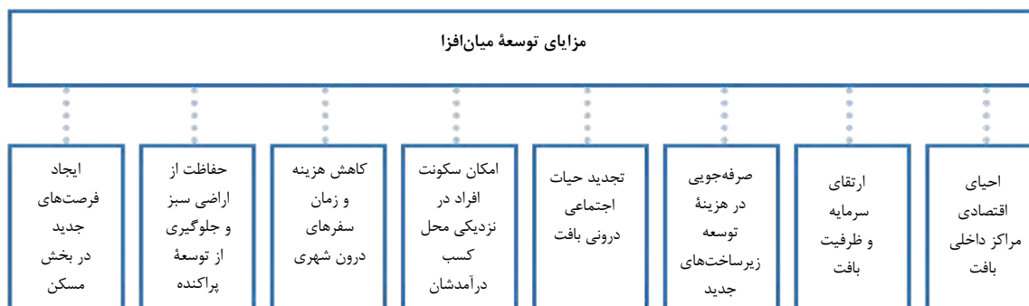
شکل ۲: مزایای توسعه میان‌افزا

مورد توجه قرار دهد. راه حل‌ها و مسائل مربوط به طراحی این گونه بناها، بر اساس ارزش‌ها و سنت‌های فرهنگی خاص منطقه تاریخی مورد نظر، نوع وضعیت ساختارهای موجود، میزان همگونی با محل و غیره متفاوت خواهد بود» (فیلدن و یوکیلتو، ۱۹۹۸).