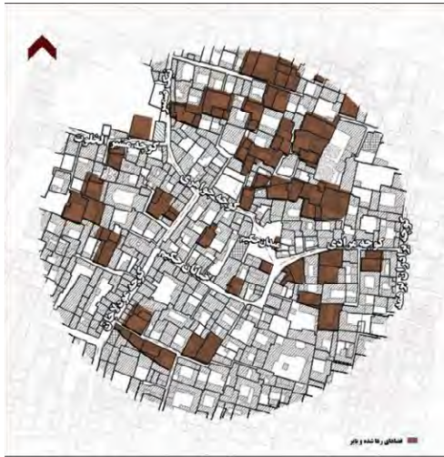
شکل ۴: زمین‌های فرسوده و بایر و رهاشده در محدوده مطالعه‌شده پژوهش