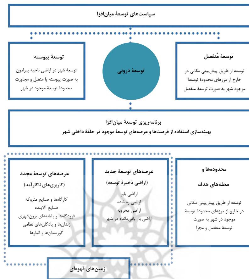
شکل ۱: سیاست‌های رشد و توسعه میان‌افزا

جدید و بافت قدیم شکل گرفته و طی داشتن انعطاف برای تغییرات بعدی در آینده، در زمان حال نیز از مطلوبیت‌های فضایی برخوردار است (EPA، ۲۰۰۴).