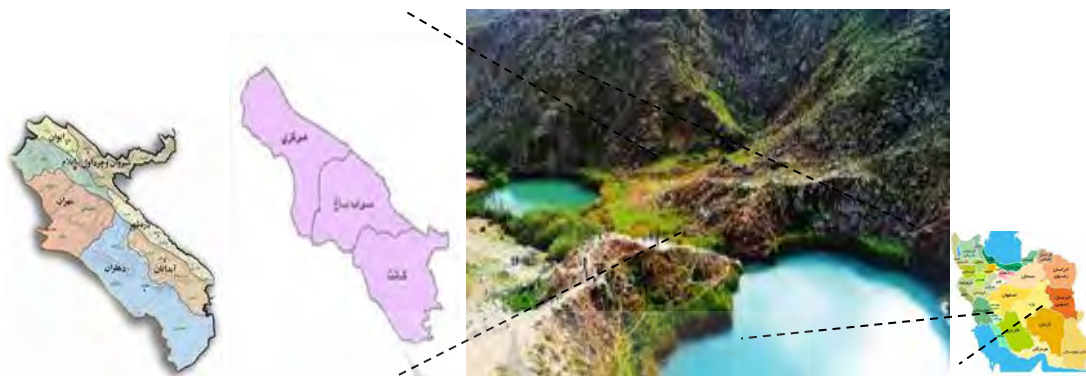
شکل ۱. موقعیت دریاچه دوقلو (سیاه‌گاو) در ایران و شهرستان آبدانان (۱)

کارشناسان ۳۸ سال بوده است. بیشترین بازدیدکنندگان بین سنین ۳۰ تا ۴۰ سال بودند یعنی ۳۶ درصد از بازدیدکنندگان از دریاچه. همچنین افراد بیشتر از ۵۰ سال کمترین درصد، یعنی ۴/۸۱ درصد از کل بازدیدکنندگان را تشکیل می‌دادند. به ترتیب ۲۵ و ۴۸ درصد از کارشناسان و بازدیدکنندگان را زنان تشکیل می‌دادند. شغل ۹۷/۵ درصد از کارشناسان دولتی و ۲/۵ درصد بازنشسته بوده‌اند. در بین گردشگران ۲۷ درصد شغل آزاد، ۱۱ درصد شغل دولتی، ۵ درصد بازنشسته، ۳۲ درصد دانشجویان و دانش‌آموزان و ۲۵ درصد زنان خانه‌دار بوده‌اند که با توجه به این موارد بیشترین گروه بازدیدکننده از دریاچه را افراد در حال تحصیل تشکیل می‌دهند. پس از آن درآمد متوسط بررسی شده است که بیشترین درصد درآمدی کارشناسان مربوط به افرادی بوده است که بین سه تا پنج میلیون درآمد داشته‌اند (۴۰ درصد افراد). همچنین، بیشترین فراوانی درآمد میان یک تا سه میلیون تومان ۳۸/۵۵ درصد گردشگران را به خود اختصاص داده است. میزان تحصیلات نیز در تحقیق حاضر بررسی شده است که ۶۲ درصد کارشناسان دارای مدرک کارشناسی بوده‌اند و ۳۰ درصد نیز مدرک تحصیلی بالاتر از کارشناسی داشته‌اند. در بین بازدیدکنندگان نیز ۳۵ درصد افراد دارای مدرک کارشناسی و ۱۹ درصد بالاتر از کارشناسی بوده‌اند. همچنین، نتایج اولویت‌بندی موانع توسعه گردشگری از نظر کارشناسان و گردشگران در جدول ۲ ارائه شده است که چهار گزینه مناسب نبودن راه‌های ارتباطی و شبکه حمل‌ونقل، نامناسب بودن امکانات بهداشتی و نبود استراحتگاه در نزدیکی دریاچه، ضعف مدیریت گردشگری و عدم هماهنگی سازمان‌های مرتبط با این