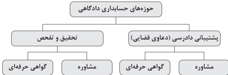
شکل ۱: حوزه‌های حسابداری دادگاهی

فعالیت دارند، می‌توانند نقش مشاور ۳۲ یا نقش گواه حرفه‌ای را ایفا نمایند. در ایران کارشناسان رسمی دادگستری، گواهان حرفه‌ای هستند که در حوزه پشتیبانی دادرسی فعالیت می‌کنند.