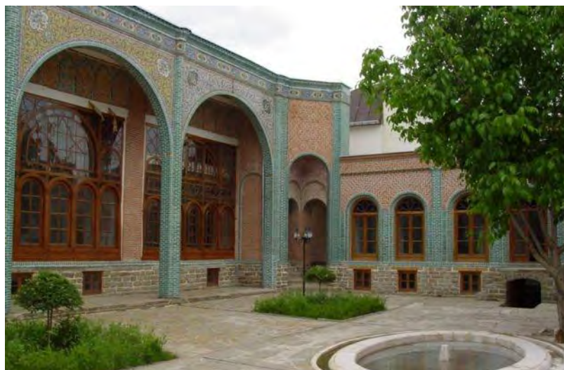
نگاره ۱- مدرسه هدایت