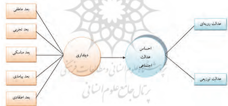
مدل نظری پژوهش