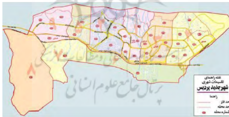
نقشه ۲- تقسیمات شهری در شهر جدید پردیس

نقش شهر جدید پردیس به مثابه شهری میانی در ناحیه شرقی منطقه شهری تهران از نظر جذب جمعیت حایز اهمیت است. وسعت پردیس ۳۷۰۰ هکتار است و طرح جامع آن در پنج فاز مسکونی و یک فاز صنعتی پیش‌بینی شده است. واقعیت‌های موجود گرایش به اسکان در در شهر جدید پردیس بعد از سرشماری سال ۱۳۷۵ نشان می‌دهد. در سرشماری سال ۱۳۷۵ در محدوده شهر پردیس خانوار جمعیتی گزارش نشده است ولی مطالعات کلیدی و آمار ثبت شده دفتر واگذاری زمین و مجوز ساخت و ساز و سازمان عمران تابستان ۱۳۸۴ نشان می‌دهد که در محدوده‌های مختلف و محلات شهری شهر جدید پردیس حدود ۱۳۴۰۰ خانوار شامل ۵۲۰۰۰ نفر سکونت داشتند (ابراهیم‌زاده، شهریاری ۱۳۸۸: ۳۷). با وجود این افق طرح جامع این شهر حداقل جمعیتی در حدود ۲۰۰۰۰۰ نفر را برای شهر جدید پردیس پیش‌بینی کرده است اما این شهر بر اساس سرشماری عمومی نفوس و مسکن ۱۳۸۵ حدود ۵۲۰۰۰ نفر جمعیت را در خود پذیرفته است. بیشتر ساکنین شهر جدید کسانی هستند که محل کارشان تهران می‌باشد. در این شهر کمبود مراکز تجاری و فروشگاه‌ها و مراکز ورزشی و بهداشتی، فضای سبز، شبکه‌های دسترسی و ... دیده می‌شود. هم‌اکنون شهر جدید پردیس دارای ۹ فاز می‌باشد که فاز ۶ و ۸ آن مسکونی نمی‌باشد. فاز ۶ این شهر سایت ماهواره، پارک فناوری، تصفیه خانه آب و فاضلاب، دانشگاه آزاد اسلامی را در برمی‌گیرد و فاز ۸ مجتمع توریستی و تفریحی دره بهشت را در بر می‌گیرد. کانون‌های عمده جمعیتی حومه شهر پردیس رودهن، بومهن، آبعلی و دماوند هستند. همچنین محور صنعتی جاجرد و محور توریستی آبعلی کانون‌های فعالیتی حومه این شهر را تشکیل می‌دهند (بانک جامع اطلاعات شهرهای جدید بی تا: ۲۳)