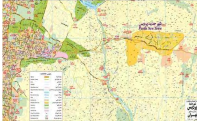
نقشه ۱- موقعیت شهر جدید پردیس نسبت به تهران