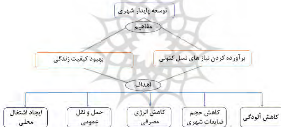
نمودار ۲- مفاهیم و اهداف توسعه پایدار (نگارندگان)

این مفهوم سعی دارد که با نگاهی نو به توسعه اشتباهات گذشته بشری را تکرار نکند و توسعه‌ای همه‌جانبه و متوازن را رقم بزند. در واقع توسعه پایدار بهبود کیفیت زندگی را در بر می‌گیرد. در نمودار ۲ به بیان مفاهیم و اهداف توسعه پایدار اشاره شده است. مفهوم پایداری در شهر و ناحیه شامل مواردی نظیر کاهش آلودگی، نگهداری منابع طبیعی، کاهش حجم ضایعات شهری، افزایش بازیافت‌ها، کاهش انرژی مصرفی، افزایش جانداران مفید در شهر و روستاها، افزایش تراکم متوسط در حومه شهری و شهرهای کوچک، کاهش فواصل ارتباطی، ایجاد اشتغال محلی، توسعه متنوع در مراکز اشتغال، توسعه شهری کوچک برای کاهش ارتقاء به شهرهای بزرگ، ساختار اجتماعی متعادل، حمل و نقل عمومی، کاهش راهبندان جاده‌ای، مدیریت ضایعات بازیافت‌نشده، توزیع منابع و تهیه غذای محلی و غیره (کازمیان وهمکاران ۱۳۹۲) می‌باشد.