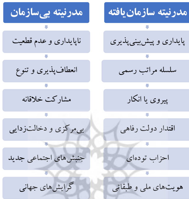
شکل شماره ۳: مقایسه عناصر مدرنیته سازمان‌یافته با مدرنیته بی‌سازمان

تحول، پدیده‌ای است که پتر واگنر ۱ از آن به‌عنوان گذار از وضعیت مدرنیته سازمان‌یافته به وضعیت جدید یا اصطلاحاً مدرنیته بی‌سازمان یاد می‌کند.