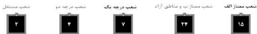
شکل ۳. دسته‌بندی شعب بانک