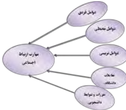
شکل ۱- مدل مفهومی پژوهش