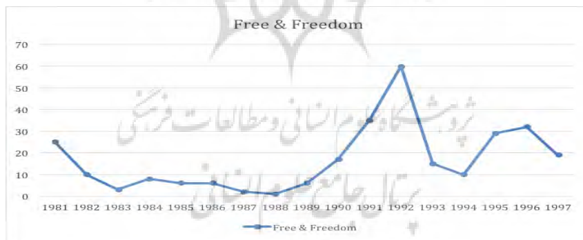
تصویر ۲. تغییر تعداد دفعات استفاده از کلمه آزاد و آزادی در پرمخاطب‌ترین روزنامه شامل صفحات تجاری و تبلیغات (۱۹۸۱-۱۹۹۷)

شایان ذکر است که روسری شانل پوششی منفعل نبود که کاربرد دیگری نداشته باشد، بلکه در مادیت آن مانند لخت بودن نوعی کنشگری وجود داشت و نوعی بلا تکلیفی برای گشت ارشاد ایجاد می‌کرد. یک عضو سابق گشت ارشاد که مدتی در محله‌های مختلف تهران همکاری کرده، گفت: «یک روسری افتاده لزوماً به معنای شورش علیه نظام نبود. اگر می‌خواستیم، می‌توانستیم تظاهر کنیم تصادفاً افتاده». این امر اختیار زیادی به گشت ارشاد می‌داد که بتوانند موقعیت را به گونه‌ای توجیه کنند که بی‌حجابی قابل اغماض باشد. با گذشت زمان، الزام به حجاب به عقب‌تر رانده شد؛ فرایندی که مادیت روسری در آن لحاظ شده بود و برای برخی متضمن معنای آزادی بود. کلمات آزاد و آزادی مانند اشیای کمی بودند که برای ترویج و سخن گفتن درباره‌ی این اشیا استفاده می‌شدند. این کلمات که در بین سال‌های ۱۳۶۰ تا ۱۳۶۸ لابه‌لای هزاران واژه گم بود، از دهه ۱۳۷۰ معنای گسترده‌تری پیدا کردند (تصویر ۲).