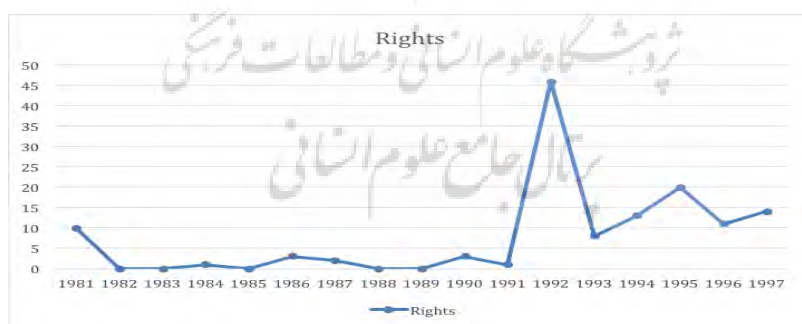
تصویر ۳. تغییر تعداد دفعات استفاده از کلمه حق در پرمخاطب‌ترین روزنامه‌ها شامل صفحات

برای عده زیادی، رؤیای انقلابی یک اتوپیای اجتماعی یا جامعه اسلامی، به رؤیای پوشیدن برند خاصی از کفش، رانندگی با میتسوبیسی و زندگی در آپارتمان‌های لوکس شمال تهران تبدیل شد؛ بنابراین اگر مفاهیم روشنفکری «فردگرایی» و «عقلانیت» رواج یافتند، تا حدودی به دلیل همخوانی این واژه‌ها با سیاست واقع‌گرای ثروت‌اندوزی بود که اولین بار بعد از انقلاب میسر شده بود. اکنون هرکسی این حق را داشت که در انتخاب در بازار متکثر، آزاد باشد. واژه حق که در طول دهه ۱۳۶۰ کمتر استفاده می‌شد، بعد از این دهه به‌شدت رواج یافت (تصویر ۳).