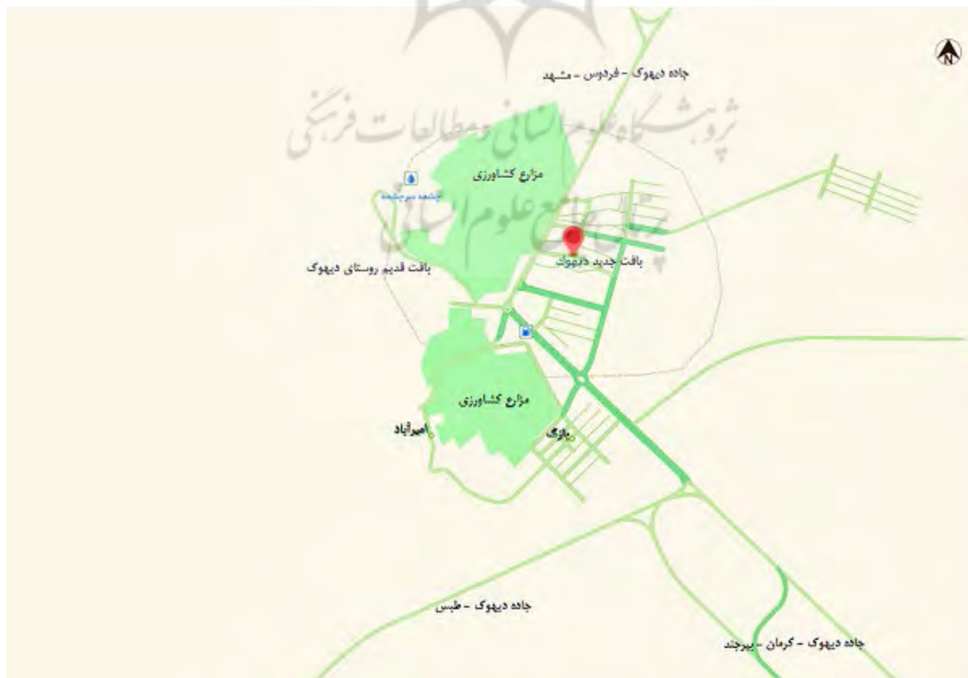
شکل ۱. موقعیت بافت قدیم و جدید دیهوک

بافت قدیم روستای دیهوک در استان خراسان جنوبی، در شهرستان طبس، بخش دیهوک و روستای قدیم دیهوک در غرب شهر فعلی دیهوک و به فاصله ۷۳۰ متری آن قرار دارد (شکل ۱). این بافت از لحاظ موقعیت جغرافیایی براساس UTM در طول و عرض ۳۶۸۴۱۴۹/۰۵۴۷۱۴۷ و ارتفاع ۱۳۷۲ متر از سطح دریا قرار گرفته است (شکل ۲). دسترسی به بافت قدیم روستای دیهوک از طریق محله انتظامیه که در گذشته جزئی از محله‌های بافت قدیم روستا بوده و امروزه هم به همین نام مشهور است، پس از عبور از این محله و طی مسیری ۵۰۰ متری به طرف شمال امکان‌پذیر است.