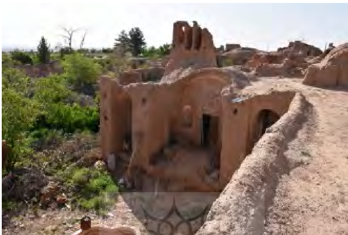
شکل ۱۰. ضلع جنوبی خانه ذبیح‌الله ذبیحی - بافت قدیم روستای دیهوک منبع: (Mahmoodi Nasab, 2018)