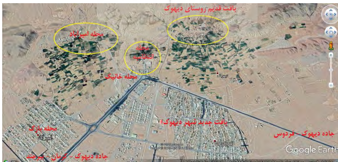
شکل ۲۱. محله‌های بافت قدیم روستای دیهوک

عامل بعدی در روند توسعه روستا بعد شکل‌گیری آن نقش بسیاری داشته و قرارگیری دیهوک در جاده ارتباطی مهم بوده است. مسیری اصلی که از دیهوک عبور می‌کرده، از شهرهای مرکزی و جنوبی ایران شروع و به سمت شمال خراسان شهرهای نیشابور و مشهد امتداد پیدا می‌کرده است. محدوده این راه ارتباطی در خراسان جنوبی براساس شواهد باستان‌شناختی (Anani, 2012; Mahmoodi Nasab, 2018) و منابع مکتوب (Afzal AIMolk, n. d.) مشخص است. دیهوک بین منزلگاه کاروانسرای چاه گنبد و عرب‌آباد - زنوگان در مسیر جاده خراسان به کرمان قرار دارد. این راه امروز در بعضی قسمت‌ها هنوز به عنوان راه ارتباطی استفاده می‌شود. مسیر دوم که به دیهوک ختم می‌شده و در مقایسه با مسیر اول فرعی‌تر محسوب می‌شده است، مسیری بوده که از طبرس به سوی کریت، اصفهک و دیهوک و سپس در مسیر فوق‌الذکر می‌گرفته است و در ایستگاه عرب‌آباد به سمت، خور، خوسف و بیرجند منتهی می‌شده است. دیهوک بین ایستگاه چاه گنبد در شمال و عرب‌آباد در جنوب شرق قرار دارد.