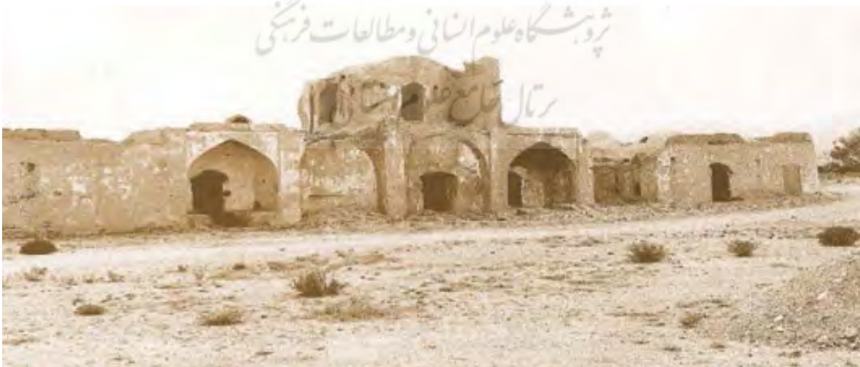
شکل ۱۵. ایوان کاروانسرای دیهوک - قبل از تخریب