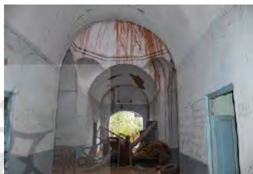
شکل ۸. فضای داخلی خانه اسدالله‌خان کلانی

متنوع فضایی در خانه‌ها و کوشک‌ها را شامل می‌شده است (Gholami & Kavian, 2016, P. 179; Judaki et al., 2014). این بناها از چهار ایوان تشکیل شده است که به صورت رودرو حول فضای میانی قرار گرفته و فضای میانی نقش رابط این ایوان‌ها را داشته است. فضای میانی چهار ایوان با ابعاد 4 \times 4 متر یا بیشتر، با حوض آبی با ابعاد در مرکز این فضا قرار دارد. چهار طرف این ایوان‌ها چهار اتاق وجود دارد که ورودی آنها از داخل ایوان‌هاست (شکل ۸). در مجموع می‌توان گفت در ساخت بناهای با این پلان ۹ فضا طراحی و ساخته شده است. این بنا بیشتر تزئیناتی از جمله کاربندی و نورگیرهایی در گنبد