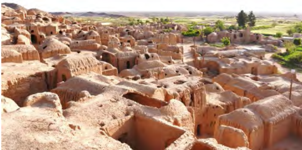
شکل ۴. بافت قدیم روستای دیهوک - دید از جنوب