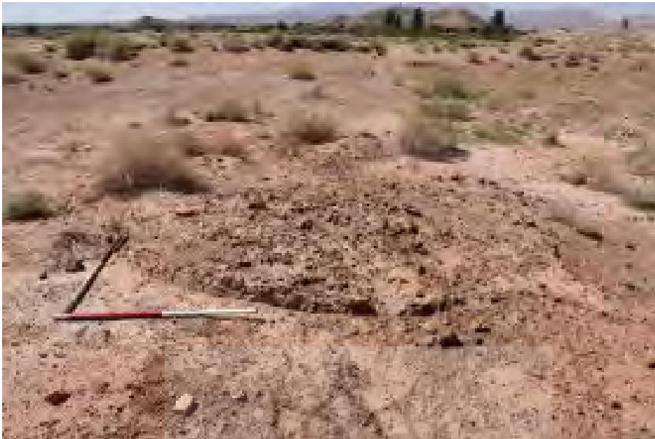
شکل ۱۹. بقایای معماری کوره ذوب سرچشمه دیهوک

چوب روشن و حرارت را ایجاد می‌کردند. با توجه به اینکه این کوره از نوع تنوری است، شاید دارای پوشش گنبدی بوده و