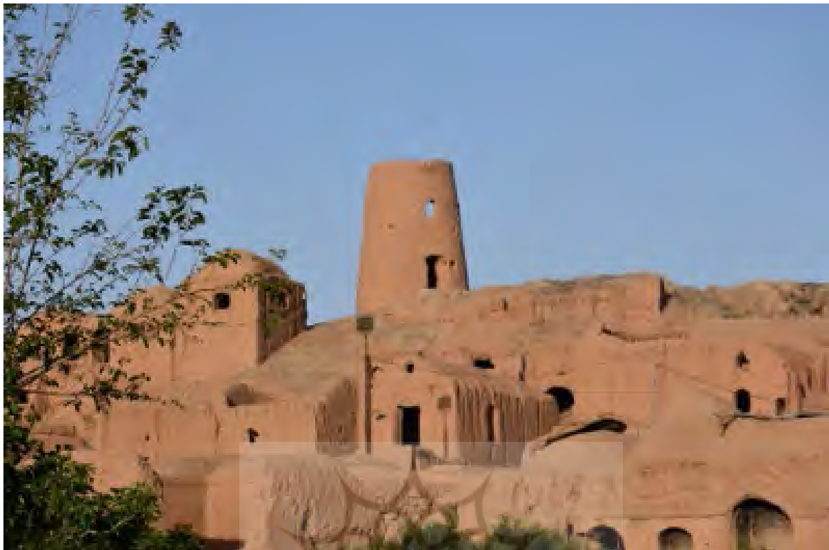
شکل ۵. دورنمای برج بافت قدیم روستای دیهوک - دید از جنوب

دیوارهای اصلی و بادگیر بنا باقی مانده است. با توجه به شواهد معماری فعلی این بنا حیاط ندارد و به سبک مسجد و به صورت شبستانی بوده است. این حسینیه با ابعاد 15 \times 8 متر و در راستای شرقی-غربی ساخته شده است. ورودی بنا از داخل ساباطی میسر می‌شود (درون این ساباط علاوه بر ورودی مسجد، ورودی چند خانه مسکونی نیز قرار دارد). بادگیر این حسینیه در ضلع جنوبی بنا به صورت یک‌طرفه رو به شمال و با سه دهانه طراحی شده است.