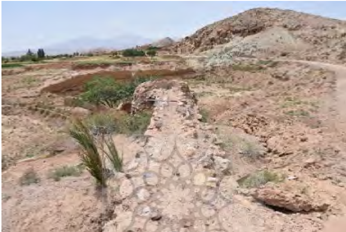
شکل ۱۳. قسمتی از جوی انتقال آب و تنوره آسیاب تک‌أو (تک‌آب)

وجود لایه‌های اندود در تنوره آسیاب نشان‌دهندهٔ مرمت آن در سال‌های مختلف است. مالکیت این آسیاب‌ها به صورت مشارکتی یا