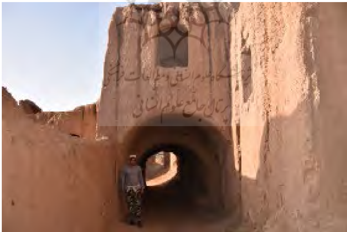
شکل ۶. ساباط‌های بافت قدیم روستای دیهوک

علاوه بر این، ساباط دسترسی به مراکز محله‌ها و حتی بازار و در بعضی موارد به عنوان یک فضای ورودی برای یک یا چند خانه طراحی شده است (Mahmoodi Nasab et al., 2016). ساباط‌های بافت قدیم روستا دیهوک در سراسر بافت قدیم روستا، به‌ویژه در نیمه شرقی بافت و در دامنه کوه صخره‌ای وجود دارد. طول و عرض این ساباطها با توجه به گذرها متفاوت است. بزرگ‌ترین ساباط با ابعاد 3 \times 12 متر با ارتفاع ۳ متر و کوچک‌ترین ساباطها با ابعاد 1 \times 5 متر با ارتفاع 1/5 متر هستند. این ساباطها معمولاً در بیشتر گذرهای اصلی بافت دیهوک دیده می‌شود. همان‌طور که اشاره شد، عوامل مهمی در شکل‌گیری این ساباطها نقش داشته‌اند؛ از جمله اینکه قسمتی از این گذرها ملک شخصی بوده که می‌توانسته است دو گذر را به هم وصل کند. مالک این قسمت از ملک خود را وقف و اقدام به ساخت ساباط می‌کرده است. بالای ساباط نیز اطاقی می‌ساخته تا کمبود زمین در ساخت خانه برطرف شود (شکل ۶) و معمولاً این فضا رو به بادهای منطقه بود که شرایط آسایش را برای مالک خانه در فصل تابستان فراهم می‌کرد. گاه درون یک ساباط ورودی به چند خانه تعبیه می‌شده است که