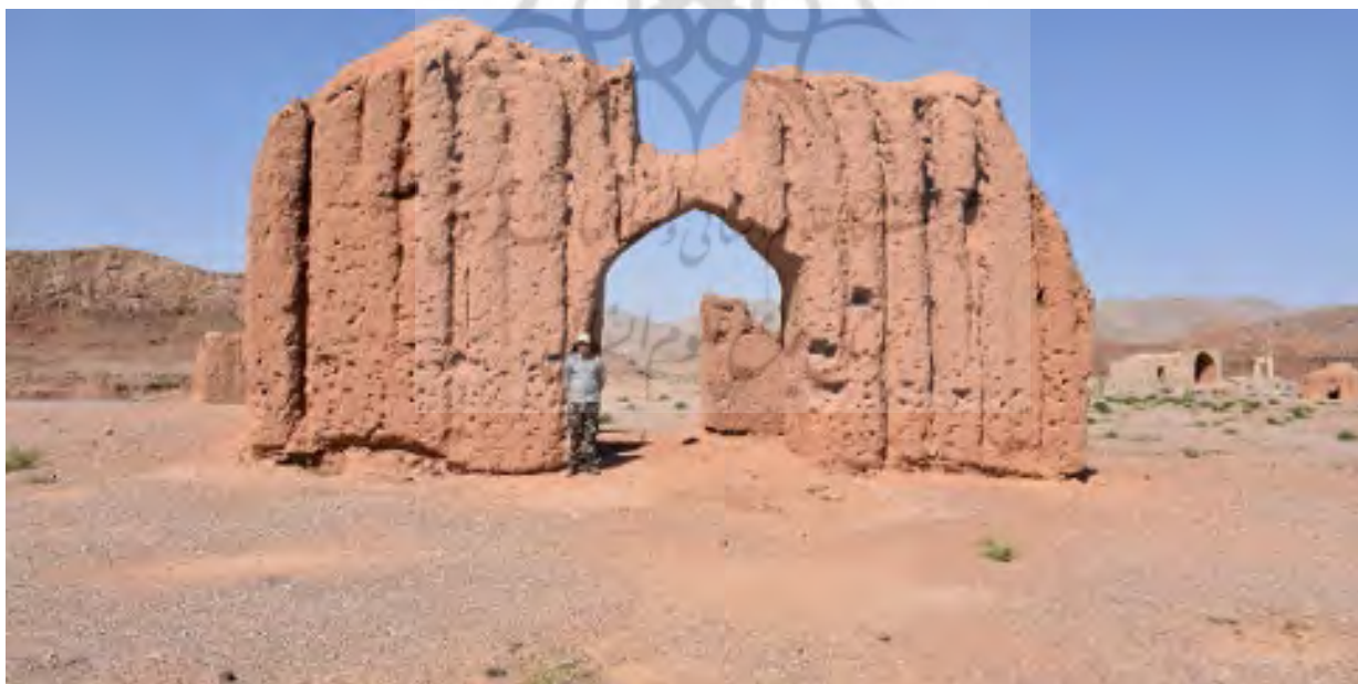
شکل ۱۸. آرامگاه قبرستان دیهوک - دید از شرق

مقبره قبرستان دیهوک که در اصلاح محلی به رباط چهاردر معروف است، به فاصله ۲۰۰ متری غرب بافت قدیم روستا در قبرستان قدیمی روستا قرار دارد. آرامگاه قبرستان دیهوک در راستای شمالی-جنوبی و با ابعاد ۱۰ × ۱۰ متر (مساحت ۱۰۰ مترمربع) و با پلان مربع ساخته شده است (شکل ۱۸). این بنا در وسط قبرستان قدیمی دیهوک قرار دارد. درباره تاریخ این بنا کتیبه یا سنگ‌نوشته‌ای وجود ندارد. نماهای خارجی بنا با گذشت زمان به دلیل زلزله و فرسایش‌های فراوان شکل اصلی خود را از دست داده‌اند. این بنا حدود ۵ متر از محیط اطراف خود بلندتر است. شکل کلی این بنا قابل‌مقایسه با بناهای چهارطاقی است و چهار ورودی در اضلاع اصلی دارد که پوشش ورودی این بنا در ضلع شمالی و غربی تخریب شده است؛ با وجود این با توجه به بقایای معماری، ورودی اصلی بنا در ضلع جنوبی قرار داشته است که به‌صورت ایوانی با طاق جناغی بوده و از دیواره اصلی جلو آمده‌تر است. امروزه این ایوان تخریب و تنها بقایای معماری آن گواه امر است. سه ورودی دیگر هم‌سطح با دیواره اصلی بنا و بدون بیرون‌زدگی است. ارتفاع این ورودی‌ها ۳ و عرض آنها ۲/۹۰