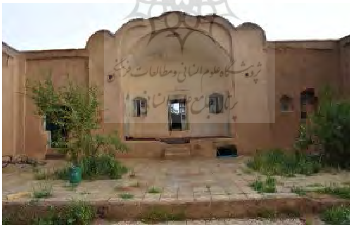
شکل ۱۱. ایوان و شاه‌نشین خانه اسماعیل خان کلانی (Mahmoodi Nasab, 2018)