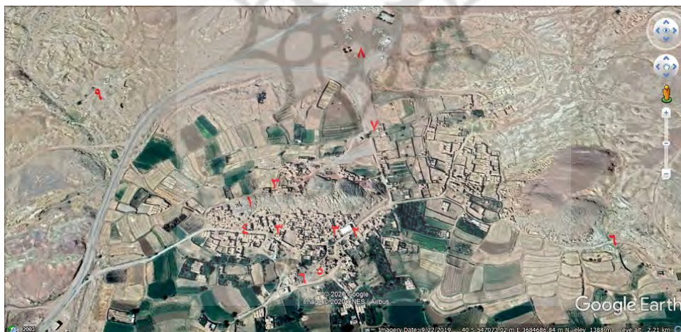
شکل ۲۰. موقعیت بناهای بافت در تصویر ماهواره‌ای (۱. قلعه و برج، ۲. مسجد، ۳. ساباط، ۴. بازار، ۵. حمام، ۶. آسیاب، ۷. آب‌انبار، ۸. آرامگاه، ۹. کوره)

امکان افزایش جمعیت در یک استقرارگاه را امکان‌پذیر و از جهت دیگری نیز آن را پشتیبان می‌کرد (Yosefifar, 2010, P. 147). با توجه به منابع، به وجود منابع آب نسبتاً کافی در شمال دیهوک اشاره شده است که از آب آن سنگ چند آسیاب می‌چرخد (Mirza Khanlar Khan, 1972, PP. 221-222). پس نقش اولیه آب در شکل‌گیری روستا، در اقلیم گرم و خشک این منطقه نیز تأثیر