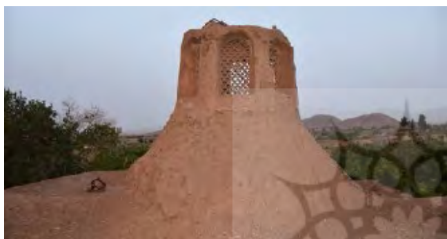
شکل ۹. کلاه‌فرنگی خانه اسدالله‌خان کلانی

مرکزی دارد که در بعضی از مواقع این نورگیرها به صورت کلاهفرنگی اجرا شده که پنجره‌های اطراف آن دارای گچبری مشبک است (شکل ۹). همچنین در اطاق مرکزی بادگیری ساخته می‌شده است که با جریان هوا در داخل آن و حوض آبی که در اتاق مرکزی بوده و با وزش و برخورد آن با آب حوض، هوای سردی در داخل خانه جریان می‌یافته است. درون بعضی از این اطاقها بخاری دیواری نیز تعبیه شده است. از جمله این خانه‌ها می‌توان به خانه اسدالله‌خان کلانی و خانه مهاجری اشاره کرد.