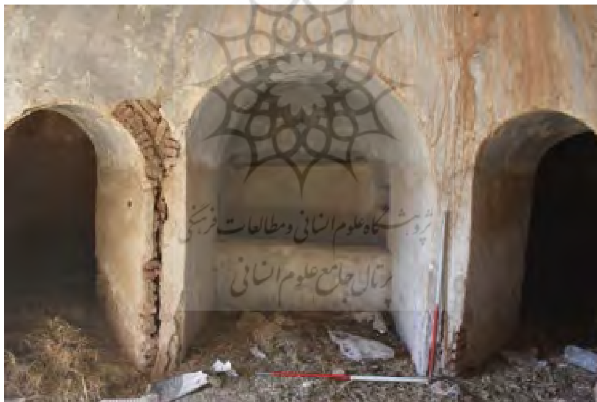
شکل ۱۲. خزینه حمام بافت قدیم روستای دیهوک منبع: (Mahmoodi Nasab, 2018)

حمام از جمله ابنیه مهم و غیرمذهبی بوده که معمولاً در مراکز محله‌ها یا در مجاورت راسته‌های بازار یا گذرگاه‌های اصلی شهرها و روستاهای قدیمی ایران احداث می‌شده است. این مکان‌ها را می‌توان یکی از ارکان مهم شهرها و روستاهای اسلامی به حساب آورد (Sabeti, 2003, P. 132). حمام بافت قدیم روستای دیهوک با ابعاد 10 \times 15 متر در راستای شمالی-جنوبی ساخته شده است. فضاهای تشکیل‌دهنده حمام عبارت‌اند از: ورودی، راهرو، رختکن، میاندر، گرمخانه و خزینه. هر فضا به صورت مستقل ساخته شده است تا دما و رطوبت هر فضا در مقایسه با فضای مجاور تنظیم شود. ورودی حمام از ضلع غربی بنا میسر می‌شود که ایوانی رفیع با ارتفاع 3/5 متر و ابعاد 2 \times 2 متر دارد. بعد از ورودی از طریق راهرویی منحنی رختکن حمام قرار دارد. سرپینه به صورت هشت‌ضلعی نامنتظم