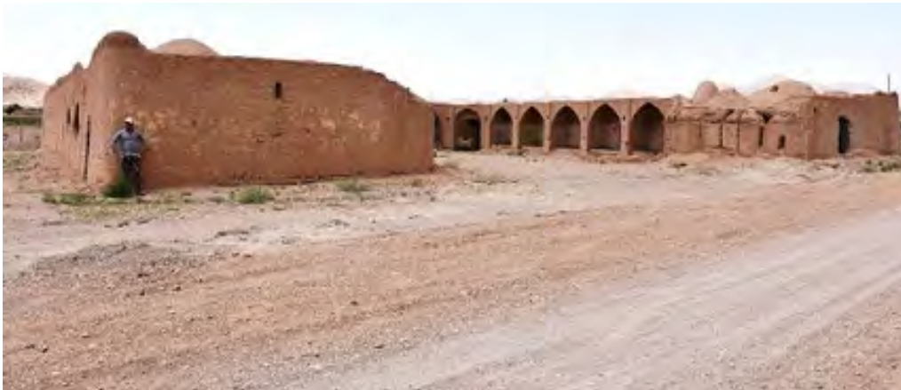
شکل ۱۶. ایوان کاروانسرای دیهوک - بعد از تخریب