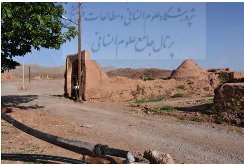
شکل ۱۷. آب‌انبار بافت قدیم روستای دیهوک

آب‌انبار یکی از بناهای زادبومی ایران و یکی از بناهای عام‌المنفعه است که منزلت و جایگاه فراوانی در فرهنگ و تمدن ایران دارد (Noor Aghayi, 2012, P. 3). آب‌انبارها از عناصر تشکیل‌دهنده بافت‌های تاریخی هستند. معماری آنها با گنبد نه‌تنها سمبل آب بلکه سمبل شهر و آبادی است. به‌دلیل نقش مهمی که آب در زندگی روزمره مردم داشت، آب‌انبار به‌صورت کانونی زنده برای محله‌ها درآمده و بناهای مهم شهر و روستا از قبیل مسجد و بازار در اطراف آن شکل گرفته‌اند (Alam alHoda, 2003, P. 89). به‌دلیل قرارگیری بافت قدیم روستای دیهوک در اقلیم گرم و خشک، اهمیت آب در فصل تابستان دوچندان می‌شود؛ به همین دلیل در این منطقه