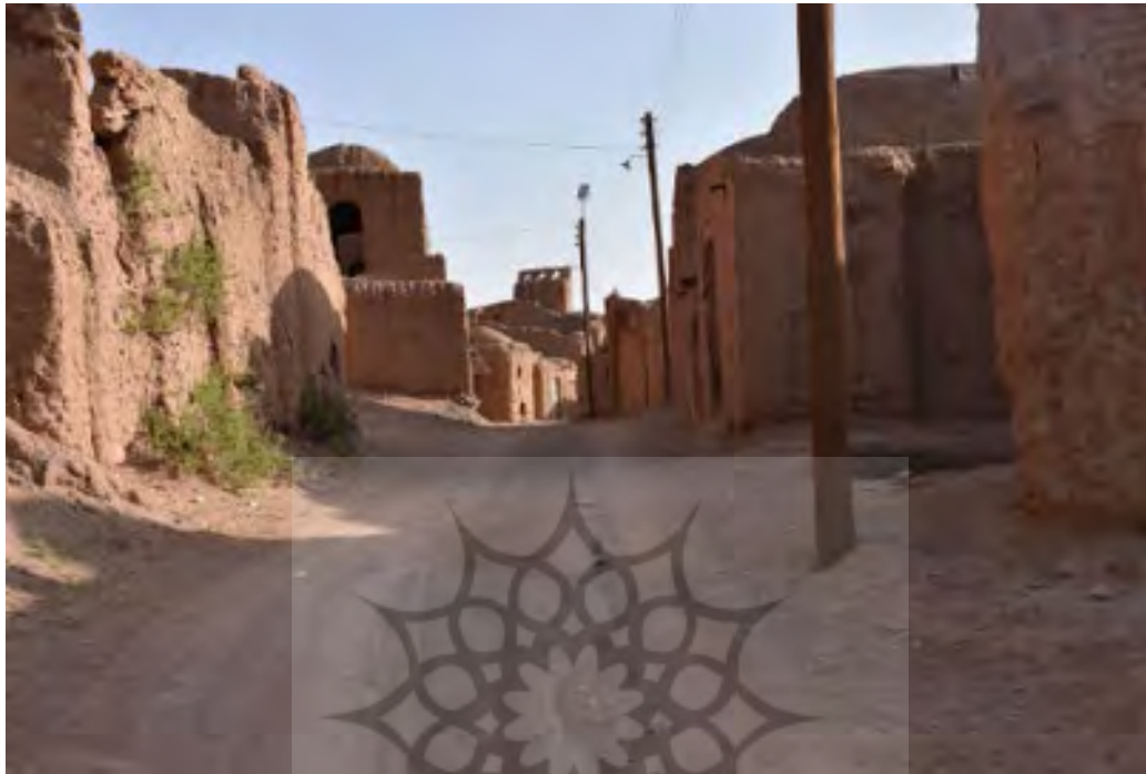
شکل ۷. گذر بازار - بافت قدیم روستای دیهوک

گذر مرکزی روستا که با عرض ۵ یا ۶ متر از شمال غرب به جنوب در امتداد بوده معروف به گذر بازار است. در گذشته، در راستای این گذر مغازه‌هایی با ابعاد کوچک قرار داشته و بعضی از عناصر بافت