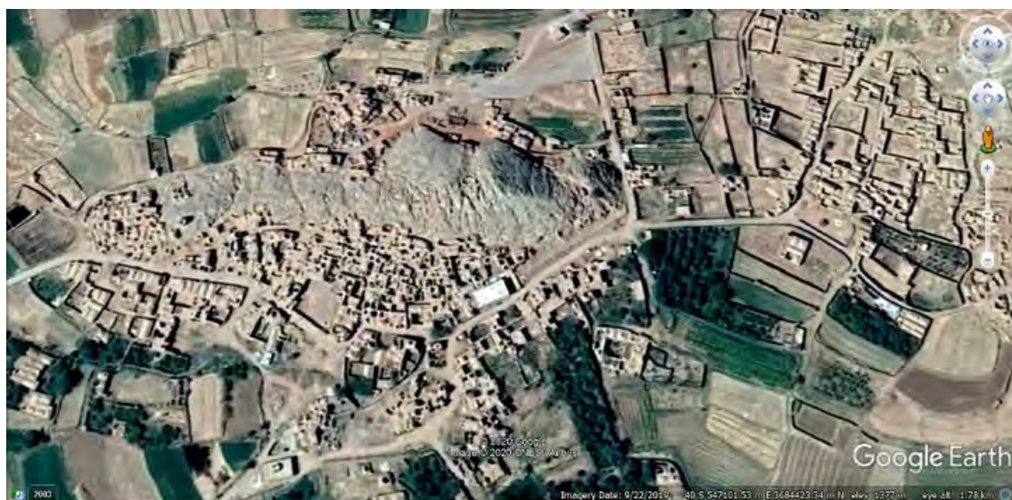
شکل ۲. بافت قدیم روستای دیهوک در تصویر ماهواره‌ای