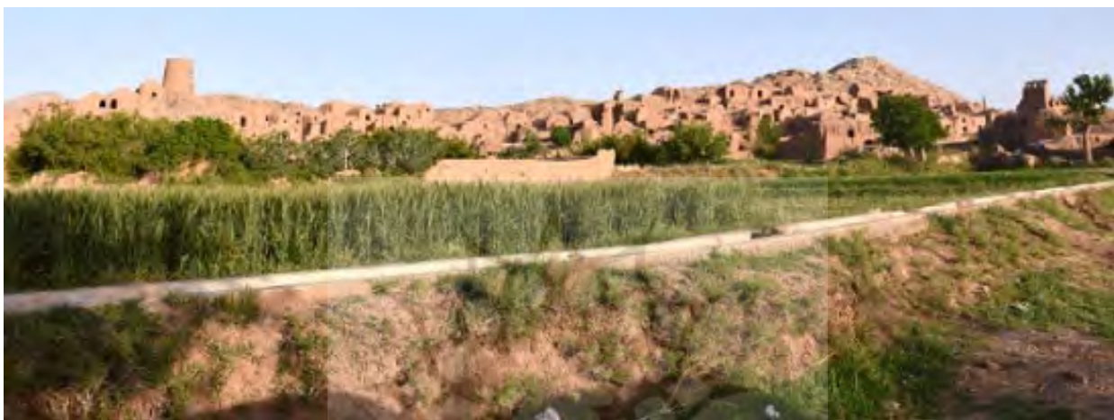
شکل ۳. بافت قدیم روستای دیهوک - دید از شرق

بافت قدیم روستای دیهوک دورتادور یک کوه صخره‌ای ساخته شده که این کوه به صورت بیضی از شمال به جنوب امتداد دارد. این بافت با طول ۴۷۰ و عرض ۲۰۰ متر به فاصله ۷۳۰ متری غرب بافت جدید شهر دیهوک قرار گرفته است (شکل ۳). این بافت در برخوردگاه جاده‌های اصلی کرمان به