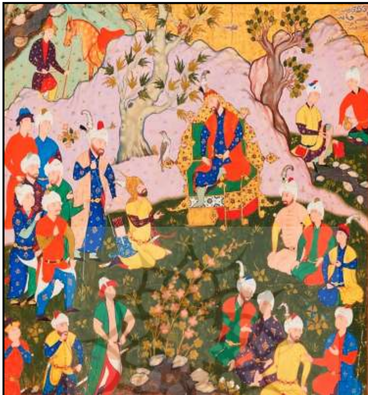
تصویر ۱: آمدن سفیر سلم و تور نزد فریدون (بخشی از اثر)، اثر صادقی بیگ، شاهنامه شاه اسماعیل دوم، ۹۸۴ق، در گوشه سمت راست بالا امضای صادقی بیگ دیده می شود