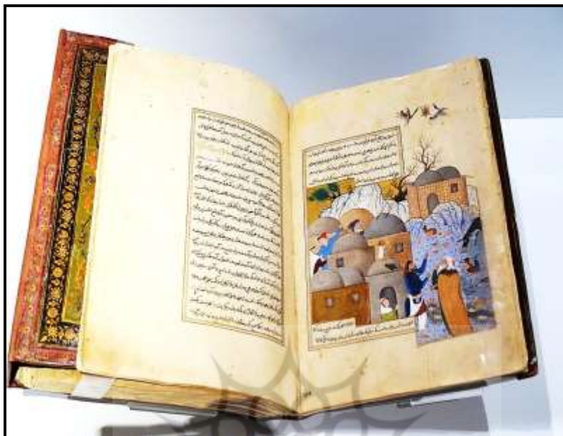
تصویر ۲: نسخه مصور انوار سهیلی محفوظ در موزه آقاخان، سفارش داده شده و مصورسازی شده توسط صادقی بیگ،

صفحه مربوط به نگاره «لاکپشت و مرغابی‌ها»