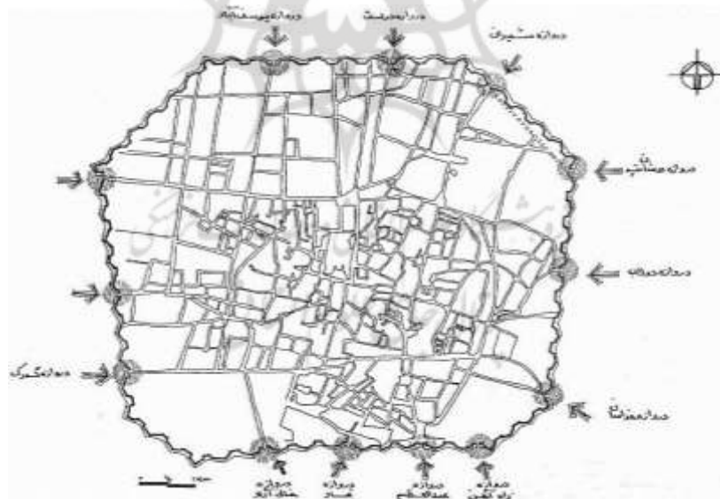
شکل ۲: دروازه‌های دارالخلافت تهران تا سال ۱۳۱۱ش (حبیبی، ۱۳۸۳، ص. ۱۳۱)