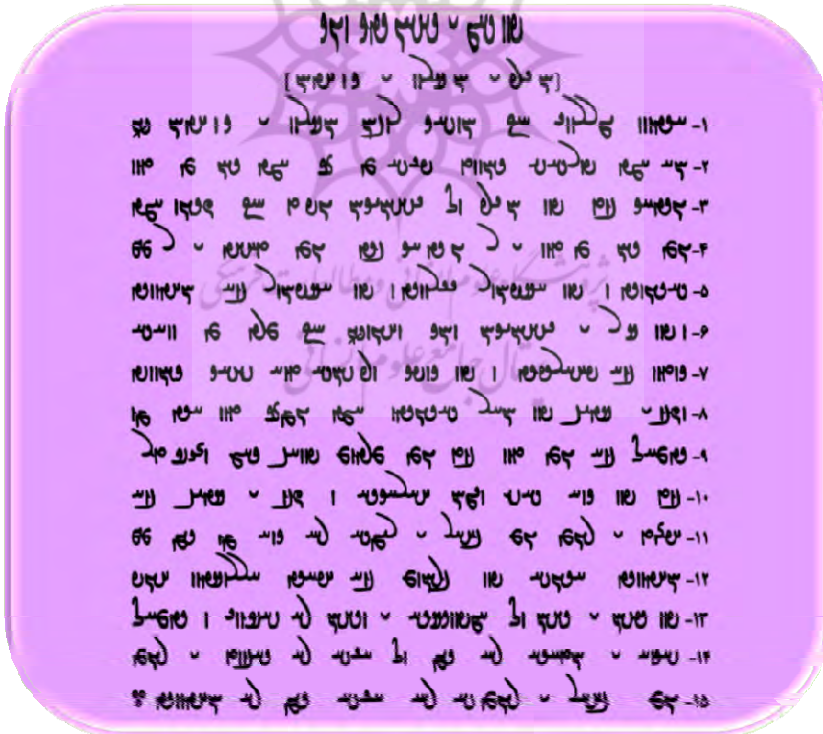
شکل ۱۰: تصویر نمونه‌ای از خط پهلوی

۵- ابتدا با استفاده از لوح فشرده به متن زیر گوش کنید و سپس تمرین کنید و به کمک هم گروهی هایتان متن زیر را حرف نویسی کنید.