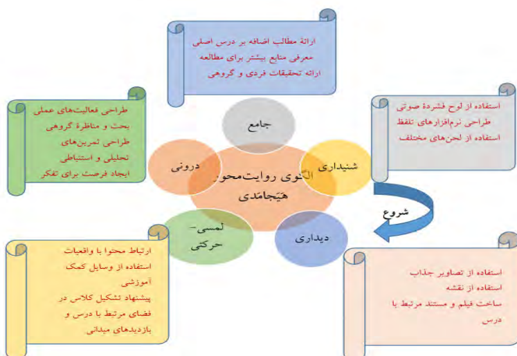
شکل ۳: الگوی روایت محور هیجانی

برای تبیین بیشتر، بخش کوتاهی از یکی از موضوعات کتاب‌های تاریخ زبان فارسی کنونی با توجه به این الگوی پیشنهادی بازنگری شده است که در ادامه به آن پرداخته می‌شود. و با اشاره به تابلوی دیگر گفت: «که این کتیبه اردشیر بابکان در نقش رستمه که به سه زبان پونانی، پهلوی اشکانی و فارسی میانه نوشته شده»