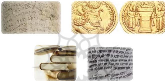
شکل ۵: تصویر نمونه‌هایی از خط پهلوی (در کتیبه‌ها، سکه‌ها و کتاب‌ها)

کتیبه را قبلاً هم دیده بودم و حتی تحلیلش کرده بودم: «بله چقدر خوب که شما از نزدیک این آثار رو دیدید، این باید همون کتیبه ملاقات اهورامزدا و ادشیر بابکان باشه که در اون اردشیر به نژاد ایزدان نسبت داده شده». او وقتی من را علاقه‌مند به این عکس‌ها دید قول داد عکس‌های بیشتری در رابطه با این موضوع به من نشان دهد و بعد از تماشای دو تابلو از من اجازه خواست تا بحث دیروز را ادامه دهد، که گفتم ترجیح می‌دهم من ادامه‌دهنده باشم و او با اشتیاق فراوان پذیرفت و به خاطر وقتی که برای آموزش مقدمات می‌گذارم از من تشکر کرد. لپ‌تاپ را روشن کردم: «خب تا این جا رسیدیم که به طور جدی خط پهلوی از دوران اشکانی تا سه قرن نخست اسلامی در