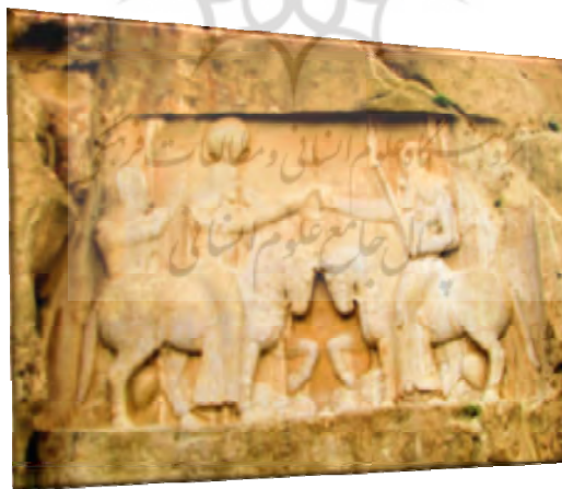
شکل ۴: تصویر کتیبه اردشیر بابکان در نقش رستم (به سه زبان پارسیک، پهلوانیک و یونانی)

برای تبیین بیشتر، بخش کوتاهی از یکی از موضوعات کتاب‌های تاریخ زبان فارسی کنونی با توجه به این الگوی پیشنهادی بازنگری شده است که در ادامه به آن پرداخته می‌شود. و با اشاره به تابلوی دیگر گفت: «که این کتیبه اردشیر بابکان در نقش رستمه که به سه زبان پونانی، پهلوی اشکانی و فارسی میانه نوشته شده»