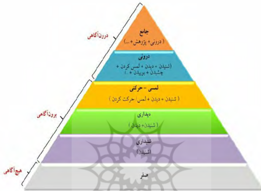
شکل ۲: هرم آموزشی هیج‌آمدی (Pishghadam, 2016)

در رابطه با موضوع میزان تسلط او به اندازه‌ای است که وی توانایی تدریس آن برای دیگری را دارد (Pishghadam et al., 2019). نمونه گویاتر مرحله‌های بالا، در شکل (۲) قابل مشاهده است: