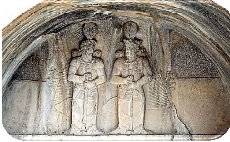
شکل ۹: تصویر کتیبه شاپور دوم و سوم در طاق بستان

۵- ابتدا با استفاده از لوح فشرده به متن زیر گوش کنید و سپس تمرین کنید و به کمک هم گروهی هایتان متن زیر را حرف نویسی کنید.