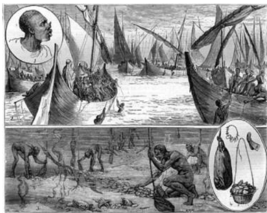
شکل ۲. نگاره‌ای از چگونگی صید مروارید در خلیج فارس و ملزومات آن

صدف‌های یک محل صید می‌شد و سپس به جای دیگری می‌رفتند (همان‌جا) (شکل ۲).