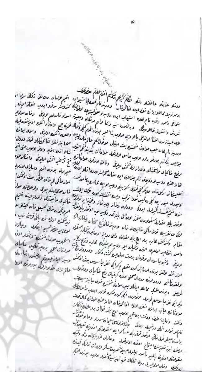
۱. گزارش یوسف پاشا والی ارزروم از تهجم کلبعلی خان نخجوانی به روستاهای قراغاب به فرمان آقامحمدخان قاجار (Osmanli arşiv belgelerinde Nahçıvan)