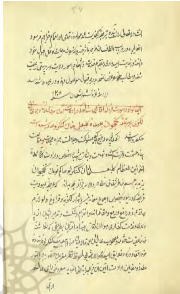
۴. فرمان آقامحمدخان قاجار دربارهٔ پریشانی ولایت نخجوان به حسین قلی خان بیگلریگی تبریز (مجموعهٔ نسخ خطی چاپ‌نشدهٔ سواد و فرامین سلاطین و امرا و حکام)