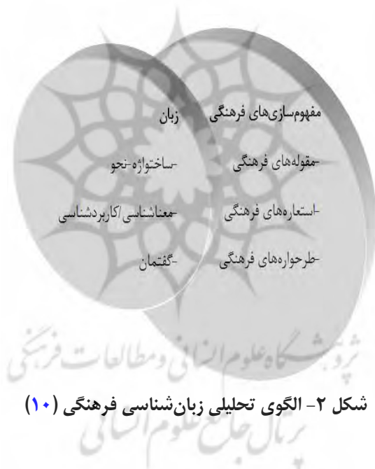
شکل ۲- الگوی تحلیلی زبان‌شناسی فرهنگی (۱۰)