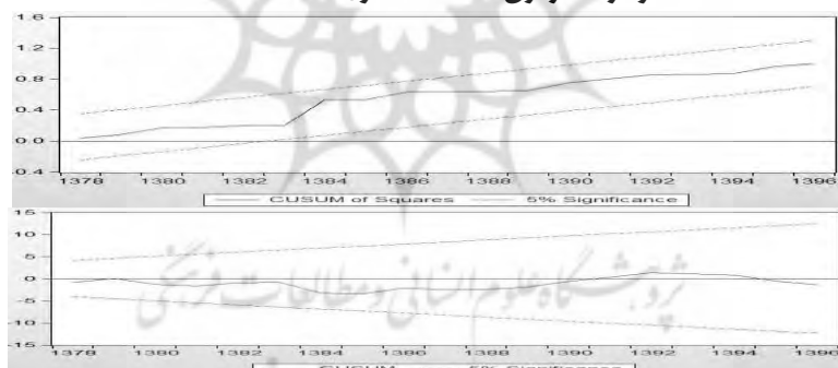
نمودار ۲- آزمون CUSUM و CUSUMSQ

برآورد الگوی کوتاه مدت و بلندمدت به ترتیب در جداول ۷ و ۸ ارائه شده‌اند.