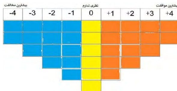
شکل ۱. جدول ۳۴ عاملی کیو