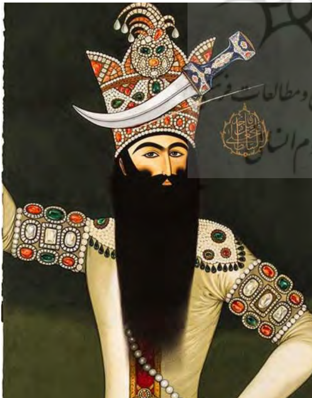
تصویر ۱. از مجموعه خاطرات انهدام، آغداشلو، ۱۳۹۲، گواش و آبرنگ روی مقوا.

اردشیر محمص با توجه به روش‌های فنی گرافیک -ویژه دوره قاجار- و ادغام آن با هنر معاصر، به زبانی بسیار آشنا، تلخ، سیاه، مستقل و خاص دست پیدا می‌کند. او با طرح‌هایی از طنز سیاه و پر از هاشورهای ریز، با جابجایی بخش‌های مختلف اندام انسانی، با نگاهی تند به دوران قاجار می‌تازد. در برخی از آثارش وقایع‌نگاری عصر تملق و شمایل قاجاری، برای او تمثیلی بیش نیست. اردشیر محمص درامی را به تصویر می‌کشد که تضادی است میان جریان مدرنیته‌سازی و شخصیت‌ها و آداب و رسوم که نشان از سنت‌های قاجاری دارد. کاریکاتورهای طراحی‌وار او، نشان از تقابلیش در برابر توحش زمانه، اختلاف طبقاتی و بحران‌های سیاسی است که به دور