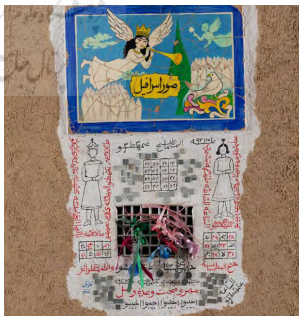
تصویر ۸. سقاخانه، پرویز کلانتری، ترکیب مواد.