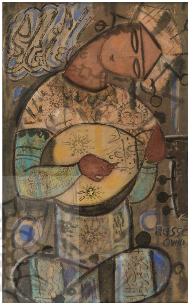
تصویر ۷. بریطوناز، ناصر اوپسی، ۱۳۳۹، رنگ و روغن.