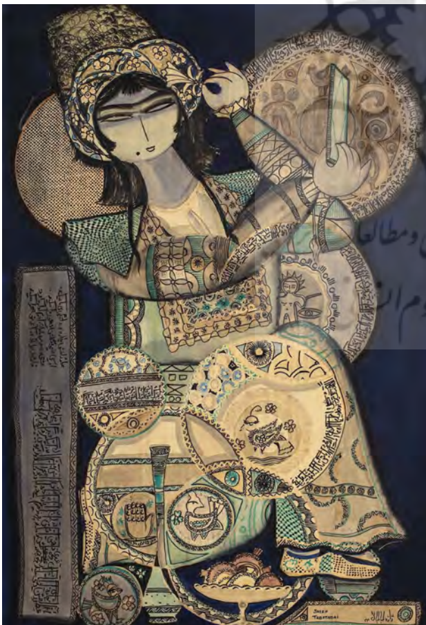
تصویر ۶. بدون عنوان، ژازه طباطبایی، رنگ و روغن، ۱۳۴۳.