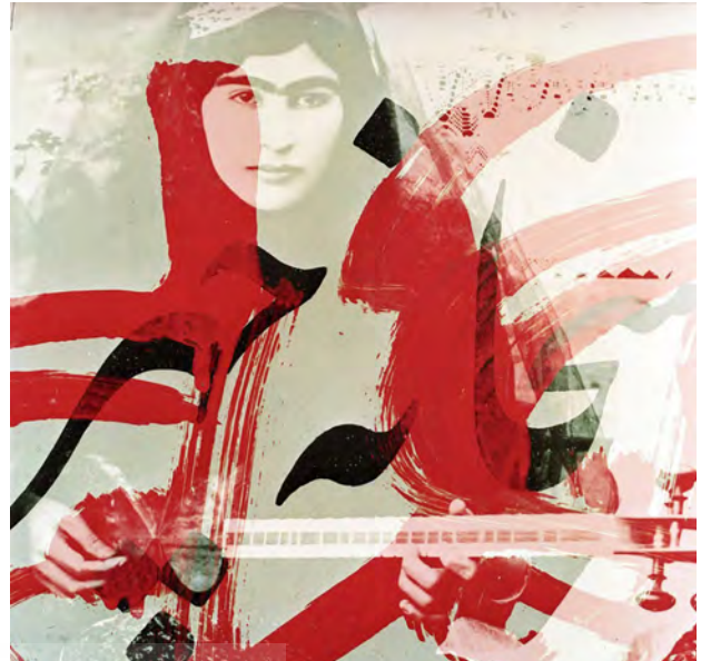
تصویر ۳. تصویر خیال، بهمن جلالی، ۱۳۸۰.