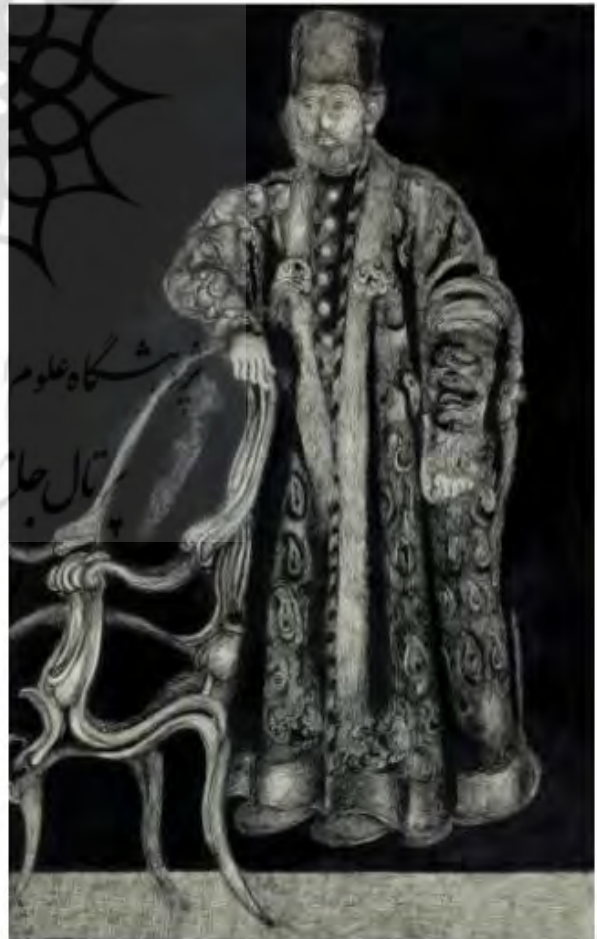
تصویر ۲. شاهزاده قاجار، اردشیر محمص، ۱۳۹۲، قلم آهنی و مرکب روی مقوا.

از کارهای جلالی تدوین و اصلاح نگاتیوهای شیشه‌ای گنجینه کاخ گلستان بود که با نگاهی متفاوت، با مونتاژ عکس‌های مربوط به دوره قاجار، مجموعه آثاری با عنوان «تصویر خیال: سیاه و سفید» و در ادامه «تصویر خیال: قرمز» را به وجود آورد. این آثار، در نگاه نخست ارجاع مستقیمی به دوره قاجار دارند که برای مخاطب آشناست اما در لایه‌های دیگر، نشانی از گرافیک، نقاشی و خط‌نوشته‌ها با بیان نمادین دیده می‌شوند. آنچه این مجموعه آثار را در رده هنر معاصر قرار می‌دهد، بازتاب دوره قاجار نیست بلکه برقراری پیوند تصویر با ادبیات و یادآوری مسائل فرهنگ ایرانی است که از ویژگی‌های مهم این مجموعه به شمار می‌رود (تصویر ۳).