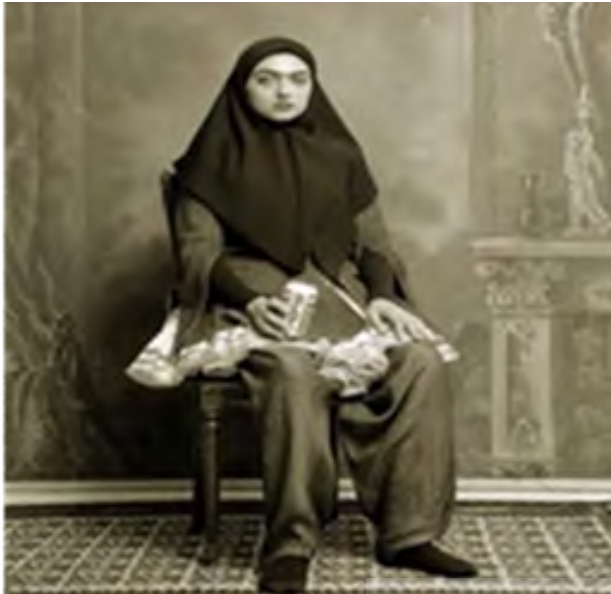
تصویر ۴. آلبوم قجر، شادی قدیریان، ۱۳۷۸.