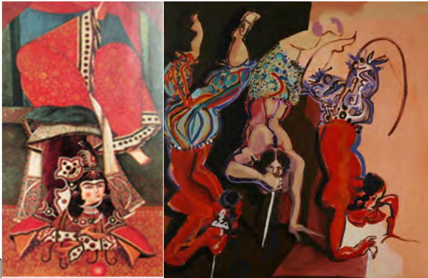
تصویر ۱۱. راست: بدون عنوان، رکنی حائری‌زاده، اکریلیک روی بوم؛ چپ: زن در حال حرکت نمایشی، منسوب به احمد، دوره قاجار، رنگ و روغن روی بوم.