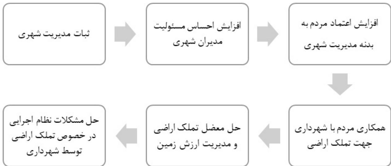
تصویر ۲. ارتباط مقوله ضعف نظام مدیریتی، مقوله نبود مشارکت سازنده و مقوله مشکلات نظام اجرایی. مأخذ: نگارندگان.