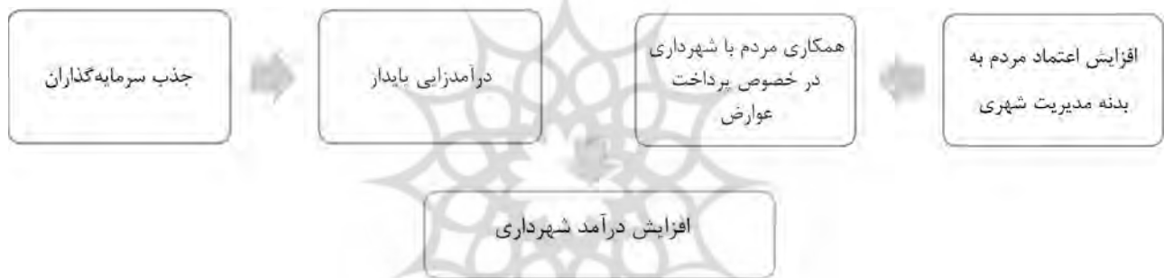
تصویر ۳. تأثیر مشارکت مردم و جذب سرمایه گذار بر افزایش درآمد شهرداری. مأخذ: نگارندگان.

محتوای صلب در کنار نبود نظام مناسب تملک اراضی و مدیریت ارزش زمین باعث شده که حقوق مالک در بسیاری از موارد در پیش‌بینی‌های طرح‌های جامع مورد غفلت قرار گیرد. به تعبیر یکی از مصاحبه‌شوندگان: «ما عادت نداریم که منافع مردم را در نظر بگیریم». به نظر می‌رسد با تدوین قوانین مناسب در زمینه تملک اراضی شهری، حقوق مالکیتی بیشتر مورد توجه گیرد. بدین وسیله مالکان احساس امنیت مالی خواهند نمود و در پی آن اعتماد بیشتری به بدنه مدیریت شهری می‌کنند. در پی شکل‌گیری اعتماد، مشارکت مردم نیز پر رنگ‌تر خواهد شد. تعاملات اجتماعی و مشارکت بیشتر، منجر به حس تعلق به محله در مقیاس خرد و نسبت به شهر در مقیاس کلان‌تر می‌شود.