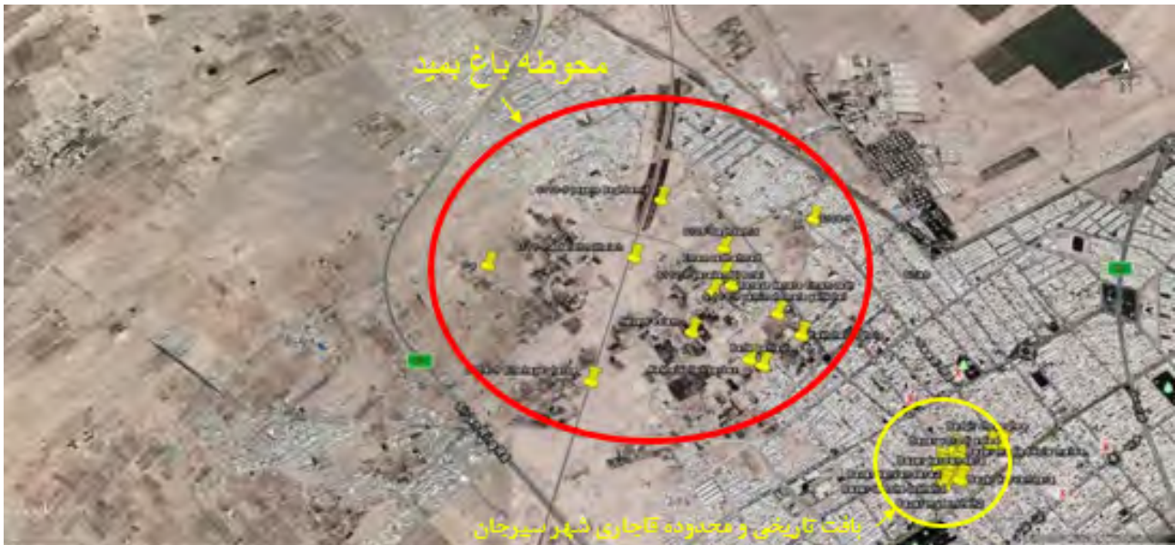
تصویر ۳. موقعیت قرارگیری محوطه باغ بیمند در شمال غربی شهر سیرجان.

نقوش سفید بر گلابه قهوه‌ای، کتیبه کوفی قهوه‌ای و سیاه در زمینه کرم و زرد و غیره طبقه‌بندی می‌شوند (تصویر ۷، ش. ۱۱ - ۸).