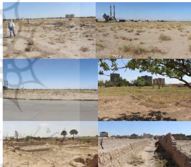
تصویر ۴. تصاویری از قسمت‌های شمالی، جنوبی، شرقی و غربی محوطه باغ‌بیمید سیرجان.

در منابع مکتوب تاریخی و جغرافیایی سده‌های اولیه و میانی اسلامی، از شهری به نام بیمند (و یا با نام‌های مختلف نزدیک به هم همچون بیمند، میمند، همید، تمید) در ایالت کرمان که در مسیر راه‌های شیراز به سیرجان قرار داشته، نام برده‌اند. طبق نوشته بلاذری این شهر در زمان حمله‌های اعراب مسلمان به ایران حیات داشته و توسط آن‌ها فتح شده که نشان می‌دهد قدمت این شهر به دوره قبل از اسلام می‌رسد. اطلاعات به‌دست‌آمده از منابع مکتوب، درباره شهر بیمند را می‌توان به دو دسته تقسیم کرد. دسته اول منابعی است که تنها به نام بردن از این شهر و دادن موقعیت و قرارگیری آن در مسیر راه‌های شیراز به سیرجان بسنده کرده‌اند، و دسته دوم نوشته‌های کسانی مانند مقدسی و ادریسی است که علاوه بر دادن موقعیت شهر به فضاها، عناصر و ویژگی‌های این شهر به‌طور مختصر پرداخته‌اند. در مورد موقعیت بیمند، اکثر منابع همچون اصطخری، ابن حوقل، ابن خردادبه آن را شهری در ایالت کرمان و در چهار فرسخی شهر سیرجان می‌دانند. ادریسی این فاصله را ۱۲ میل عنوان کرده که با چهار فرسخ تقریباً به یک اندازه است. چهار فرسخ بین ۱۸ تا ۲۰ کیلومتر است (قیصری‌نیا، ۱۳۹۶، ۹۲)، که با فاصله امروزی محوطه باغ‌بیمید از شهر قدیم