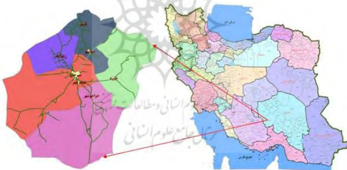
تصویر ۲. موقعیت شهرستان سیرجان در نقشه ایران.

ایران، شانگهای و تا ماندا در شرق آفریقا به فراوانی به دست آمده است (Zhang, 2016, 189-193). یک قطعه از این گونه سفالی در محوطه باغبمید به دست آمده که دارای خمیره سنگی و با لعاب سفید روشن مایل به آبی با نقوش کنده است (تصویر ۶، ش. ۶).