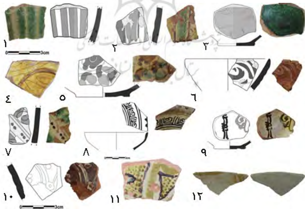
تصویر ۷. نمونه‌هایی از سفال‌های لعابدار تکرنگ محوطه باغ‌بمید.