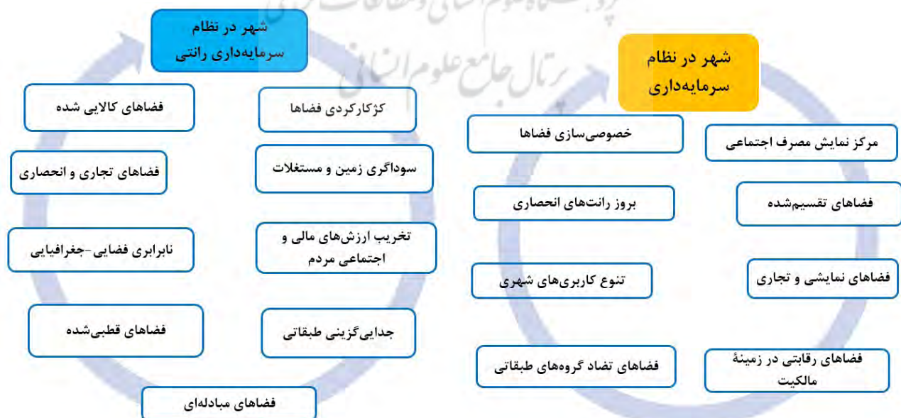
تصویر ۵. تأثیر شهری‌شدن رانت بر فضای شهر تهران.

امروزه شهرها به‌عنوان یکی از عظیم‌ترین دستاوردهای فرهنگ و تمدن و یکی از فراگیرترین پدیده‌های اجتماعی عصر حاضر به شمار می‌آیند. شهرها بستر فضایی مناسب برای نمایش تأثیرات نظام‌های مختلف اقتصادی، سیاسی،