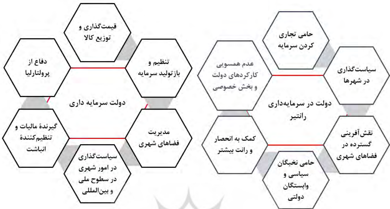
تصویر ۲. دولت در نظام سرمایه‌داری و سرمایه‌داری رانتیر.

همچنین فضا را از ساکنین شهر گرفته و بازتولیدی جدیدی ایجاد نموده که روزبه‌روز شاهد ازدست‌دادن فضاهای عمومی به معنای واقعی خود هستیم. فضاهایی که با دگرپسویی مواجه و به فضاهای بسته و کنترل‌شده مبدل شدند. فضاهای عمومی شهری به دلیل کنترل مناسبات رفتاری مردم، تجاری شده است. مانند پارک آب و آتش، و سیاست‌های نانوشته شهری شکلی از توسعه فضا را ایجاد کرده که متعاقب آن شکل خاصی از رفتار را می‌طلبد.