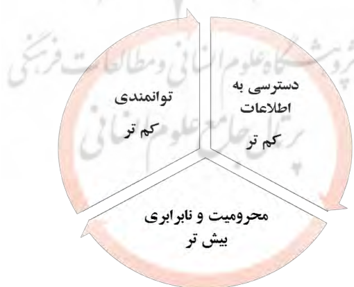
شکل شماره ۲. دور باطل توانمندی کمتر، دسترسی آزاد به اطلاعات کمتر و محرومیت و نابرابری بیشتر

به لحاظ شماتیک می‌توان این موضوع را به قرار زیر توضیح داد: