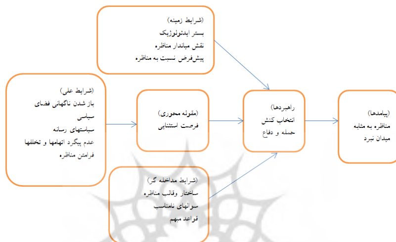
نمودار ۲- الگوی پارادایمی پژوهش

اتخاذ رویکرد حمله و دفاع را بر اساس الگوی پارادایمی در جی تی ام سیستماتیک را با در نظر گرفتن شرایط علی و زمینه‌ای مرتبط با مقوله محوری که استفاده از فرصت استثنایی مناظره برای کسب رأی بیشتر و برد مناظره و کسب یا حفظ مقام سیاسی می‌توان مطابق با نمودار ۲ ترسیم نمود.