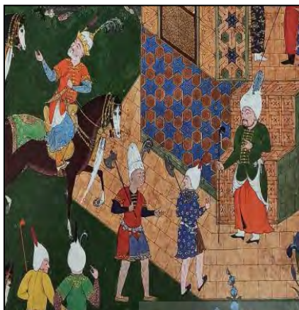
تصویر ۸. شاطران با کلاه بلند و تبرزین در دست در جلوی اسب بزرگان (حسینی‌راد، ۱۳۸۴: ۲۰۴).