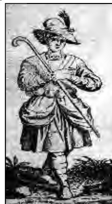
تصویر ۲. تن پوش شاطر (میرجعفری، ۱۳۵۶: ۶۰).