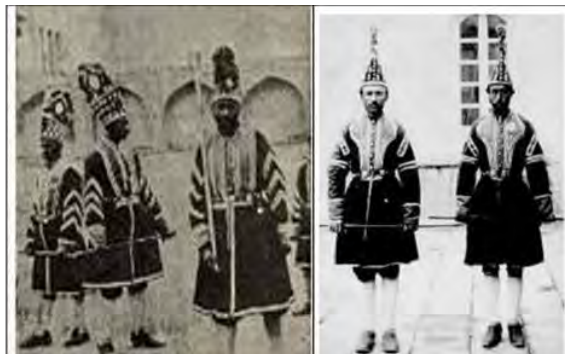
(تصویر ۱۰). شاطران در عهد ناصرالدین شاه سال ۱۲۵۰ (کاظمینی، ۱۳۵۳، ۲۰۵-۲۰۶)