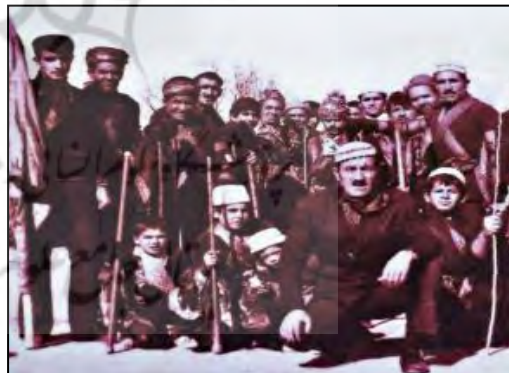
تصویر ۱۶. سردسته شاطران با کلاه کج در جلو و پسران و نوه‌های بهرامیان در لباس شاطری در پشت سر دسته شاطران در روستای جزن.