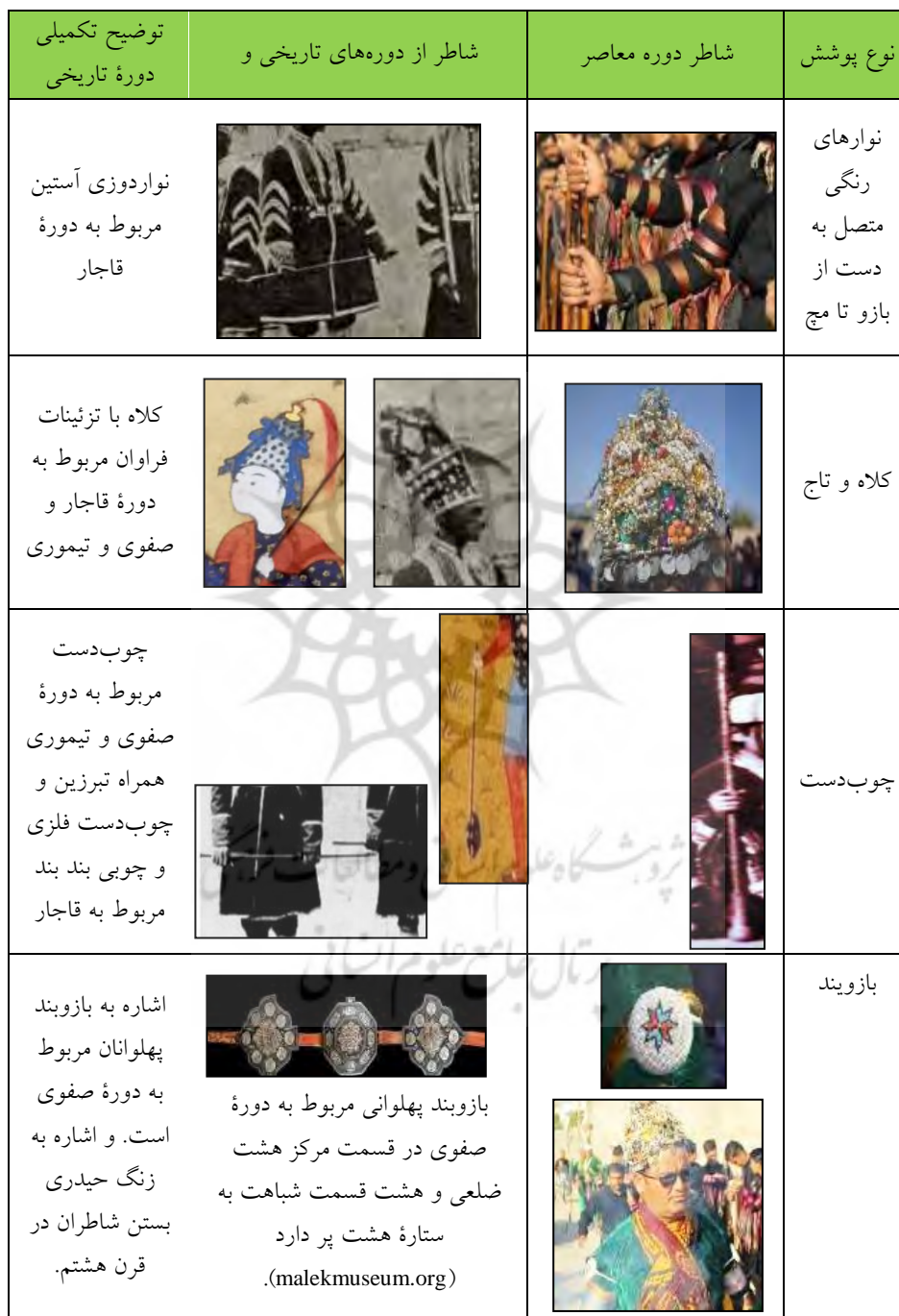
جدول ۲. شباهت لباس شاطران معاصر با شاطران در دوره‌های تاریخی