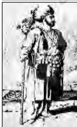
تصویر ۴. شاطر عهد شاه سلطان حسین صفوی. (کاظمینی، ۱۳۵۳: ۲۰۲).