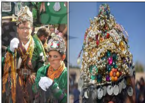
تصاویر ۱۴. کلاه تاج مانند تزئین دار شاطران در مراسم تعزیه روستای جزن دامغان (تقی‌پور، م، ۱۴۰۰) آرشیو دهیاری جزن).