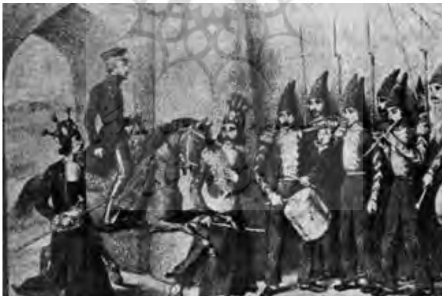
تصویر ۹. پوشش شاطران در زمان محمد شاه قاجار (کاظمینی، ۱۳۵۳: ۲۰۷)

لباس شاطرها در زمان ناصرالدین شاه، سرداری ۱۱ از ماهوت سرخ بود که دامن چین‌دار داشت و روی سینه و حاشیه‌ها و آستین آنها با نواردوزی و تکه‌های برنجی زیب و زیور می‌شد. کمربند پولک‌دار خوش‌نمایی، سرداری را به بدن برازنده تر و محکم‌تر نگه می‌داشت. کلاه تاجی، کنگره‌دار و بزرگ بود که با گل‌های پشمی سرخ و سیاه و سبز گلدوزی می‌شد. جوراب، پاتاوه سفیدی بود که تا سرزانوها می‌رسید و لبه شلوار سبز ماهوت را در زیر می پوشاند. چوب‌دستی‌ها اشکال مختلفی داشتند (تصویر ۱۰) (کاظمینی، ۱۳۵۳: ۲۰۷). هنگامی که ناصرالدین شاه به اتریش رفت و لباس گارد امپراتوری را دید، پس از بازگشت به تهران، گروه شاطر شاهی را با الگوبرداری از لباس گارد امپراتوری اتریش برای خود تدارک دید (تصویر ۱۱). آنان باید پا به پای حرکت کالسکه، در کنار و، یا در جلوی آن می‌دویدند (سعدوندیان، ۱۳۹۰: ۱۴۸).