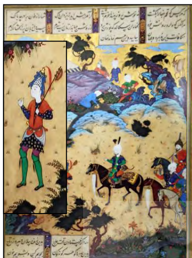
تصویر ۶. تن پوش شاطر و کلاه تزیین‌دار (حسینی‌راد، ۱۳۸۴: ۸۶)