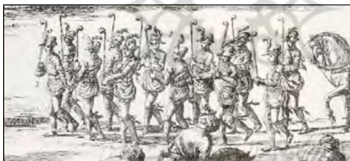
تصویر ۱. دوازده شاطر در پیشاپیش شاه سلیمان صفوی در باغ هزار جریب اصفهان در حال حرکت (کمپفر، ۱۳۵۰: ۲۳۳).

شاطرهای عهد شاه صفی، قبایی بلند می‌پوشیدند و گوشه‌های دامن آن را به عقب برمی‌گرداندند و محکم به کمر می‌بستند. پیراهن یقه گرد تا بالای زانوها می‌رسید. یک کلاه پوستی که آفتابگردانی بزرگ داشت بر سر می‌گذاشتند و پری به پهلوی کلاه می‌زدند که علامت شاطری هم بود. آنها شلواری تنگ داشتند که پاچه‌های آن را در زیر مچ پیچ می‌بستند. کفش سبک و نرم به پا می‌کردند تا آسان و تند بدونند. به اطراف کمر بند خود تعدادی گوی و، یا زنگوله می‌آویختند که از علائم مخصوص شاطرهای آن زمان بود و عصای سرکج بلندی به دست می‌گرفتند (تصویر ۲) (میرجعفری، ۱۳۵۶: ۶۰). تصویر شماره ۳ اثر هنرمند رضا عباسی در قرن ۱۷ میلادی است که رابرت شرلی ۱ جهانگرد و ماجراجوی انگلیسی را به تصویر کشیده است. پوشش شاطران در قسمت جوراب به جای مچ‌پیچ، کلاه، پر، بندینک‌های دور بازو و عصا به پوشش رابرت شرلی بسیار شبیه است و این‌طور به نظر می‌آید که نوع پوشش او مورد تقلید شاطران قرار گرفته است.