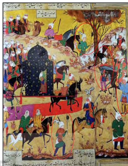
تصویر ۵. شاطران با پوشش خاص در جلوی اسب بزرگان در صحنه استقبال تیمور از همسر امیرزاده جهانگیر (یزدی، ۹۳۵: ۷۰۸).

در نگاره مربوط به نسخه تاریخی خمسه طهماسبی در کتابخانه بریتانیا لندن، پیرزنی در حال اعتراض به سلطان سنجر سلجوقی ترسیم شده است. نگارگر، شاطر را در جلوی اسب سلطان سنجر قرار داده و طریقه صحیح به زمین گذاشتن چوب‌دست شاطری را به تصویر کشیده است. سبک این نگاره به شیوه مکتب دوم تبریز است (تصویر ۷) (پاکباز، ۱۳۸۱: ۲۰۶). در شاهنامه شاه طهماسبی ، نگاره‌ای منصوب به قاسم علی و میر مصور، سیاوش در حال گشت و گزار در سیاوشگرد، بر در کاخ فرنگیس به تصویر در آمده که در جلوی اسب بزرگان، شاطران قرار دارند (تصویر ۸).