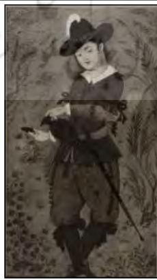
تصویر ۳. نقاشی سر رابرت شرلی، قرن ۱۷م. اثر رضا عباسی مجموعه ریتلینگر (پوپ، ۱۳۸۷: ۹۱۹)