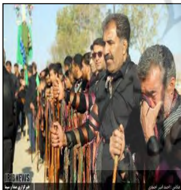
تصویر ۱۷. دسته شاطران همراه چوب‌دست و دستمال‌های ارغوانی رنگ در حکم بال‌های فرشته (آئین مذهبی شاطری جزن. www.irna.ir/news . ۱۳۹۸)

شال تن پوش و مچ پیچ: بر روی سینه شاطران شالی ابریشمی به شکل ضربدر به بدنشان پیچیده است و سینه و بازوانشان را محکم نگه می‌دارد و به کمر متصل می‌شود. دستمال‌هایی هم به دور گردن می‌بندند و جوراب‌هایی ساق بلند همانند مچ پیچ‌های مختصری هم به دور پای خود می‌پیچند (تصاویر ۱۸، ۱۶، ۱۵، ۱۴ و ۱۹).