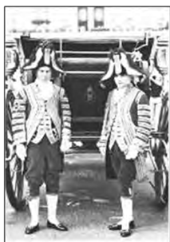
(تصویر ۱۱) لباس شاطران دربار سلطنتی آلمان (steeie,1955,p 371)