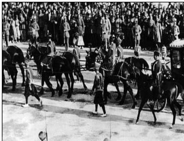
تصویر ۱۲. شاطران با کلاه‌های بلند و تزیین شده در روز تاجگذاری رضا شاه پهلوی. سال ۱۳۰۵.