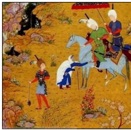
تصویر ۷. طریقه صحیح روی زمین گذاشتن چوب‌دست شاطر در نگاره حکایت سلطان سنجر و پیرزن (شاهنامه طهماسبی، نگاره ۷۶۲)