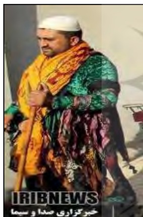
تصویر ۱۵. کلاه ساده و گرد بدون تزئین شاطران در مراسم تعزیه روستای جزن (آیین مذهبی شاطری جزن).

پوش همراه حضرت زینب (س). با توجه به اینکه شأن و حیثیت اربابان از کثرت شاطران همراه آنها مشخص می‌شود، جز این شش شاطر، دسته‌ی زیادی از شاطران نیز وظیفه‌ی دویدن در جلوی اسب امام حسین را دارند. جمعیت شاطران را هم پدران و هم پسران تشکیل می‌دهند (تصویر ۱۴ و ۱۵). در روز عاشورا، شاطران پس از پوشیدن لباس، بر چشمان خود سرمه می‌کشند. سرمه کشیدن می‌تواند نشان ارزشمندی خاک پای امام حسین و خلوص شاطران و فدا شدن در راه امام حسین باشد. این افراد، جلوی اسب امام حسین (ع) و یارانش می‌دوند و به نوعی از ورود سیدالشهدا و شهدای کربلا به میدان جنگ ممانعت می‌کنند ۱۴ (تصویر ۶). حرفه‌ی شاطری در این روستا موروثی است و از پدر به فرزند منتقل می‌شود (آیین مذهبی شاطری جزن، ۱۳۹۸، www.irna.ir/news ).