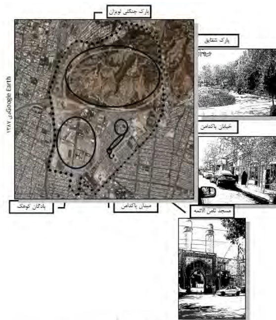
شکل ۳. پراکنش جغرافیایی برخی نشانه‌های خاص محله شمیران نو