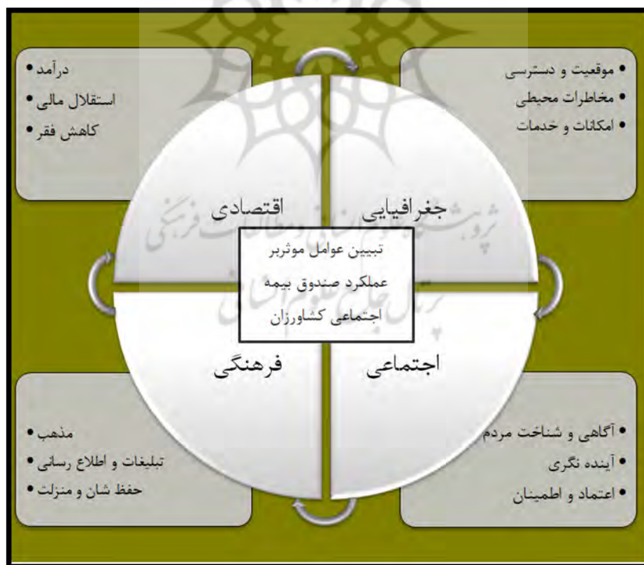
شکل ۱. مدل مفهومی تحقیق