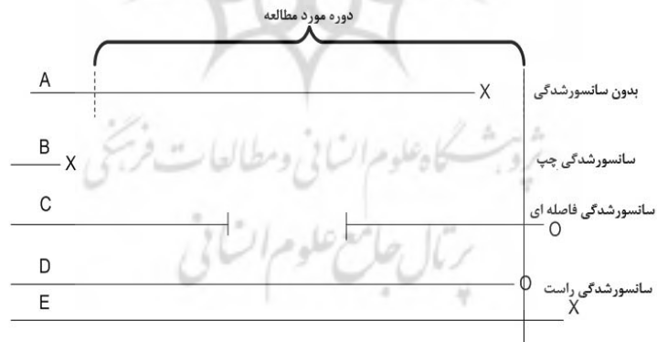
شکل ۱- انواع سانسورشدگی داده‌ها

مطالعه خارج شوند. از آن جایی که به طور دقیق مشخص نیست که پیش آمد مورد نظر برای این دسته از بنگاه‌ها چه زمانی رخ می‌دهد و یا اصلاً رخ خواهد داد یا نه، تنها مورد قابل درک این است که حادثه تا پایان مطالعه هنوز اتفاق نیفتاده است، به این موارد سانسورشدگی گفته می‌شود. اگر از دست دادن اطلاعات بنگاه نوعی پس از ورود بنگاه به مطالعه اتفاق افتد، سانسورشدگی را سانسورشدگی راست و اگر از دست دادن اطلاعات بنگاه نوعی قبل از شروع مطالعه باشد، به آن سانسورشدگی چپ و در نهایت اگر از دست دادن اطلاعات بنگاه نوعی در بین دو دوره‌ی ابتدایی و انتهایی باشد سانسورشدگی فاصله‌ای گفته می‌شود (شکل ۱). سانسورشدگی داده‌ها سبب می‌شود که تخمین با مدل‌های متعارف دارای تورش باشد و در نتیجه نمی‌توان بر نتایج چنین تخمین‌هایی اتکا کرد. برای برطرف کردن مشکلات فوق و در این میان، یکی از مهم‌ترین انواع مدل‌های نیمه پارامتریک در تحلیل بقا، مدل ارائه شده توسط کاکس در سال ۱۹۷۲ می‌باشد که در آن فرض می‌شود تابع مخاطره به صورت نیمه پارامتریک تابعی از زمان و متغیرهای توضیحی است و به آن مدل مخاطره‌ی نسبی کاکس گفته می‌شود. مدل رگرسیونی کاکس کاربردی‌ترین مدل در تحلیل بقا بوده و در بیش‌تر پژوهش‌ها از آن استفاده شده است. این مدل به پیش‌فرض‌های کم‌تری در مقایسه با مدل‌های پارامتریک (نضیر وایبل، نمایی و لگ نرمال) نیازمند است.