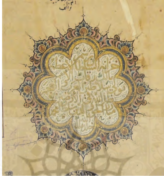
الف: معیار جمالی و مفتاح ابواسحاق، گ ار، شماره ٢٧٦٨، کتابخانه سرز، سلیمانیه، استانبول