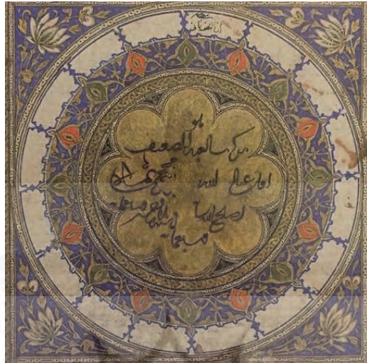
شاهنامه استیونز، گ ۷۰، LTS1998.1.1، گالری سکلر، واشنگتن