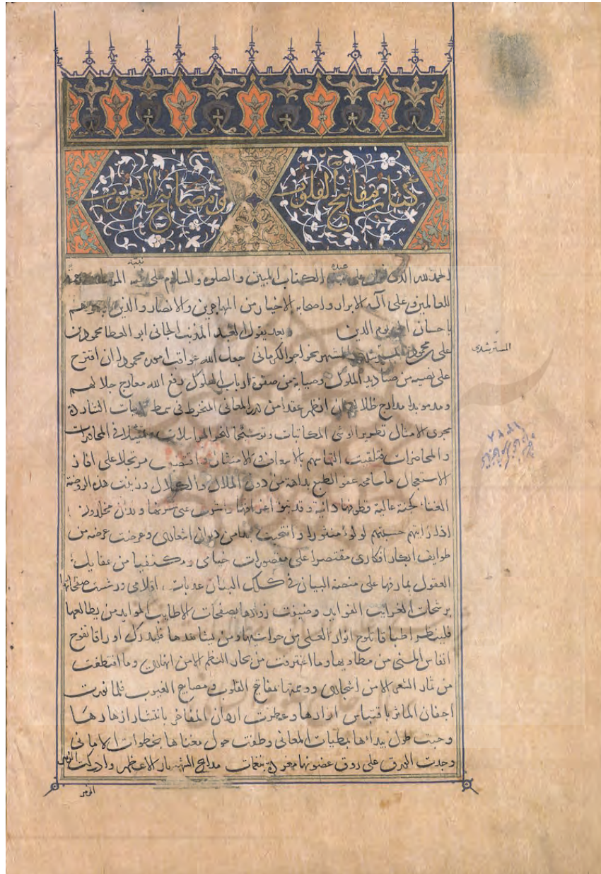
مفاتیح القلوب و مصابیح الغیوب، گ ۱ب، نسخه شماره ۲۰۴۳، دانشگاه تهران