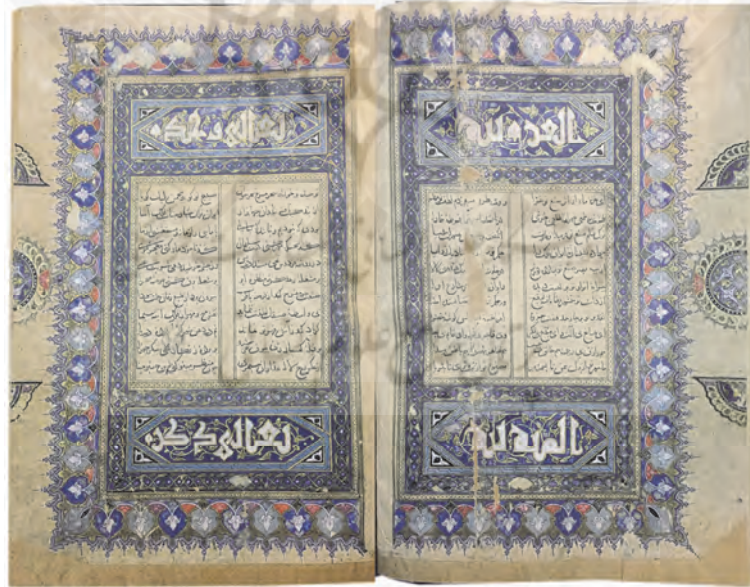
ب: دیوان خواجو، گ ۳ و ۴، نسخه Or. 11519 کتابخانه بریتانیا، لندن