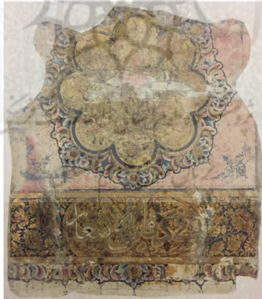
ب: مونس الاحرار فی دقائق الاشعار، گ ار، MS LNS 9، دارالآثار الاسلامیة، مجموعة الصباح، کویت