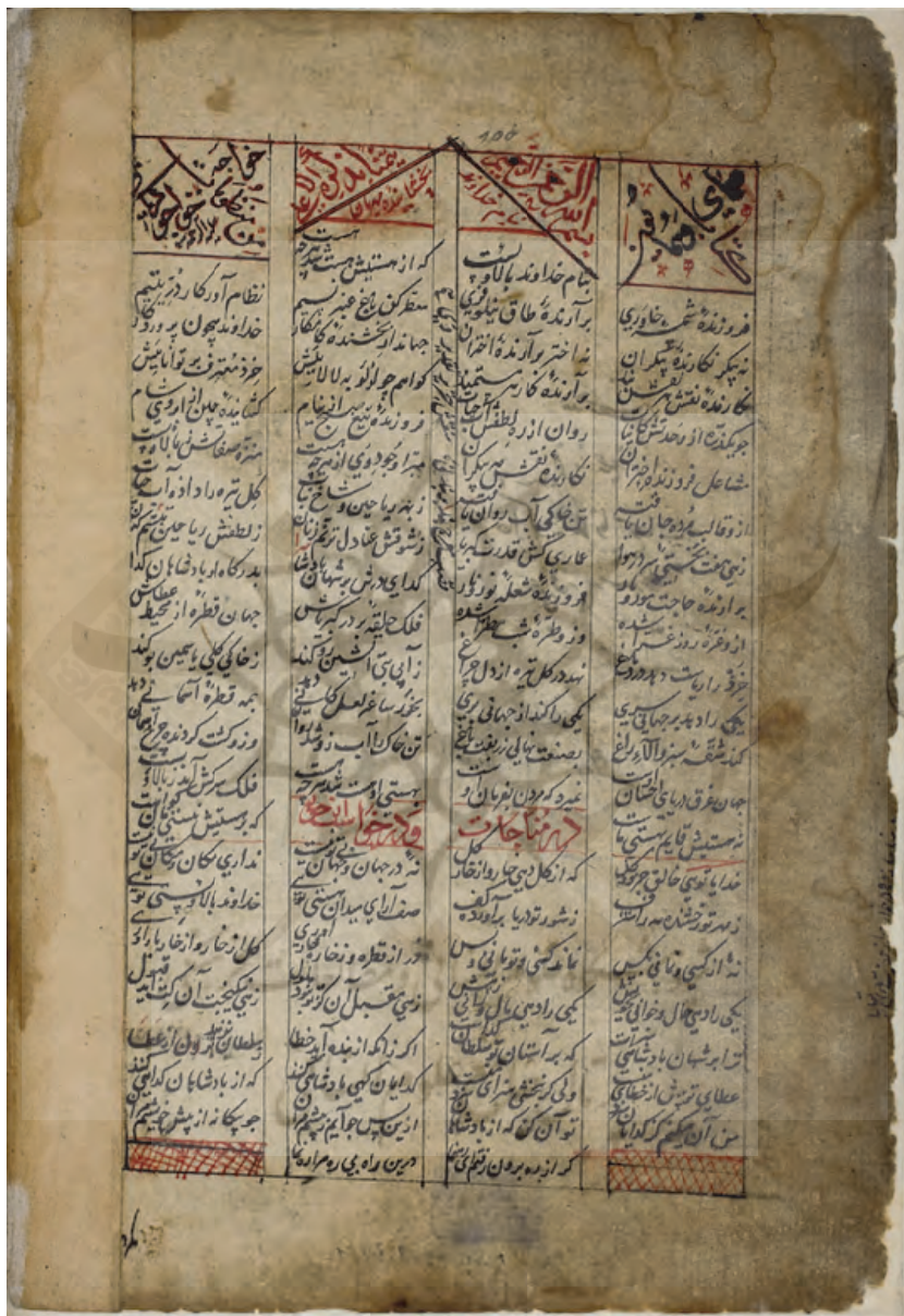
مثنوی همای و همایون، Cod. Mc. Pers. 47، کتابخانه دانشگاه گوتینگن