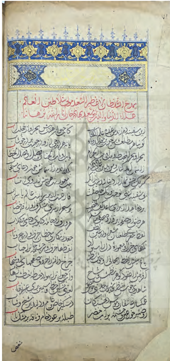
دیوان خواجه، گ ۲۱، Or. 8201، کتابخانه بریتانیا، لندن