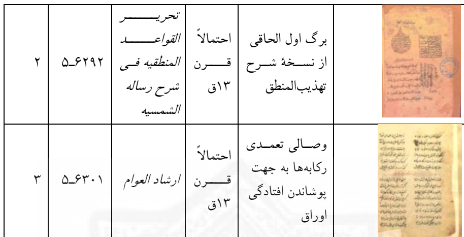
جدول ۵. نسخه‌های تفکیک شده