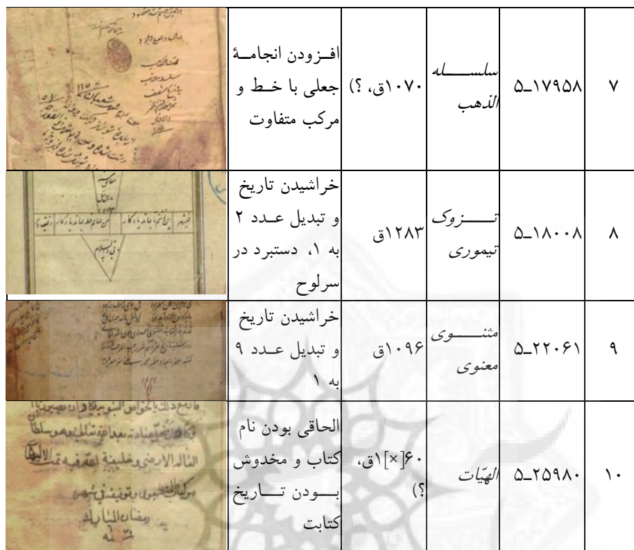
جدول ۴. نسخه‌های کامل نمایانده شده