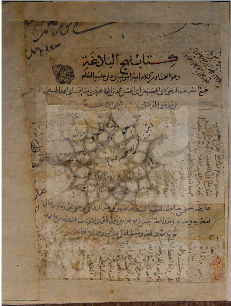
تصوير ٦. نهج البلاغه نسخه ٥٠٨ كتابخانه مركز احياء ميراث اسلامي