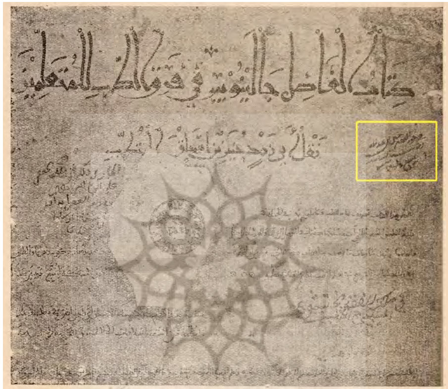
تصویر ۵. دستخط ابن سینا در نسخه ۲۸۵۹ کتابخانه ملی پاریس