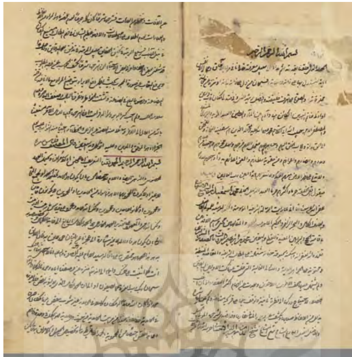
صفحة اول نسخة مجلس شماره ۱۵۰۲۶

پژوهشگاه علوم انسانی و مطالعات فرهنگی پرتال جامع علوم انسانی