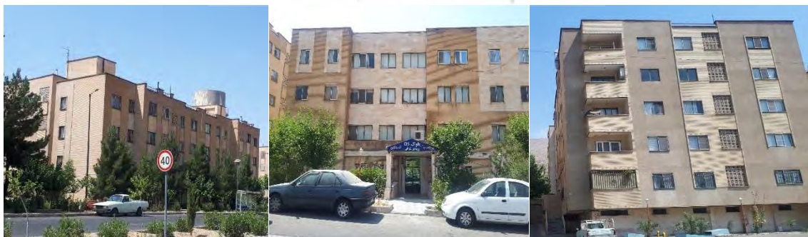
تصویر شماره ۶- عکس هایید از نمای شهرک مسکونی امید دژبان

تمام واحد های این ساختمان ها دارای پارکینگ و انباری می باشد. در برخی از بلوک ها نیز، آسانسور تعبیه شده است. شهرک امید دژبان، دارای دو تپ سازه است. برخی از بلوک ها از اسکلت بتنی و برخی از بلوک ها از اسکلت فلزی تشکیل شده است. نمای برخی از ساختمان ها را سنگ و آجر و نمای برخی دیگر را سیمان تشکیل داده است.