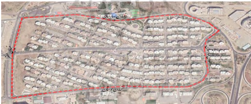
تصویر شماره ۱- عكس هوايي شهرک مسکوني شهيد باقري

این شهرک مسکونی در منطقه ۲۲ تهران و در مجاورت آبشار تهران قرار گرفته است. این شهرک در شمال دریاچه خلیج فارس و پارک جنگلی چیتگر و غرب شهرک نمونه قرار دارد. زمان ساخت برخی قسمت های این شهرک مربوط به ۲۰ سال پیش است لذا دارای دو نوع بافت قدیمی و جدید می باشد. این شهرک که توسط تعاونی مسکن سپاه احداث شده، امتیاز آن به سازمان آتش نشانی و تعاونی نظام پزشکی واگذار شده است.