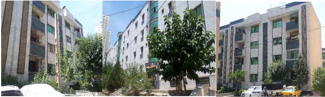
تصویر شماره ۴- عکس هایید از نمای شهرک مسکونی ساحلی