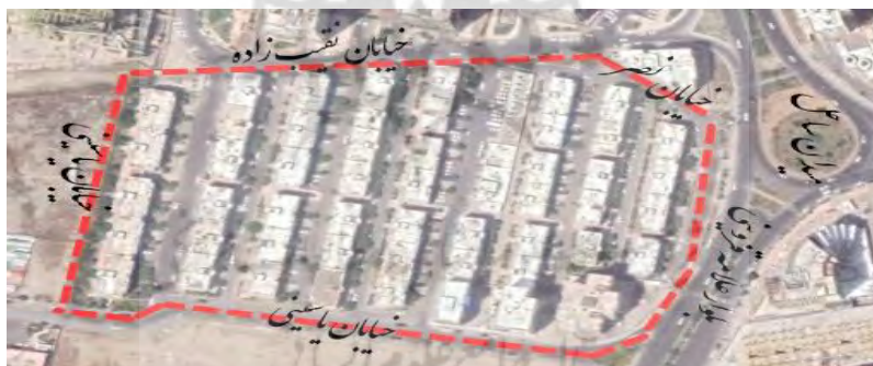
تصویر شما ۳- عکس هوایی شهرک مسکونی ساحلی

شهرک ساحل یکی از قدیمی ترین شهرک های منطقه ۲۲ می باشد که دارای قدمتی ۱۵ ساله می باشد. این شهرک که در ضلع شمالی دریاچه چیتگر واقع شده قدیمی تر از دریاچه می باشد. این شهرک توسط تعاونی مسکن فرهنگیان اجرا و ساخته شده است.