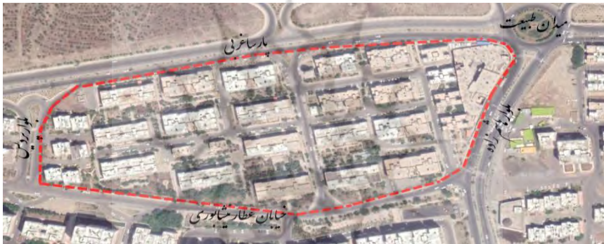
تصویر شما ۵- عکس هوایی شهرک مسکونی امید دژبان

شهرک امید دژبان یکی از شهرک های است که حدود ۱۲ سال پیش در قسمت شمالی بزرگراه همت در منطقه ۲۲ ساخته شده است. شهرک امید دژبان یکی از شهرک های معروف و با قدمت در این منطقه است که توسط تعاونی مسکن ارگان ارتش ساخته شده است. در این شهرک، حدود ۸۵۰ واحد مسکونی وجود دارد که این واحد ها، بین ۲۸ بلوک ۴ طبقه تقسیم شده اند، بدین صورت که در هر کدام از بلوک ها، ۳۶ واحد مسکونی وجود دارد.