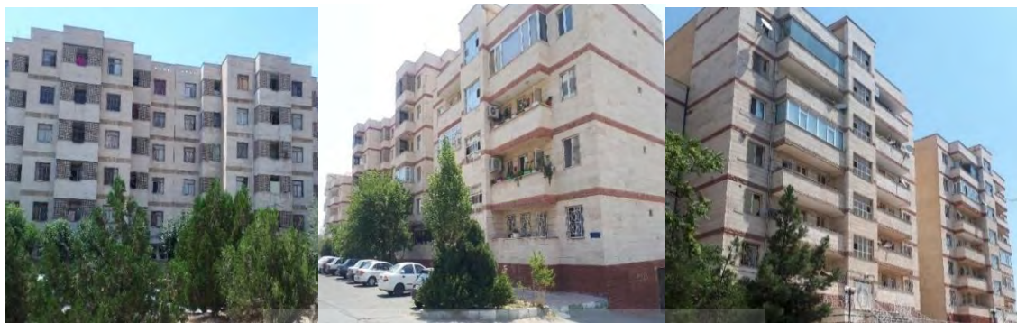
تصویر شماره ۲- عکس هایی از نمای شهرک مسکونی شهید باقری

آن منفی و متعلق به پارکینگ، ۱ طبقه متعلق به لابی به همراه لابی من ۲۴ ساعته و ۱۲ طبقه مثبت می باشد. از نکاتی که درباره این برجها باید دانست، سازنده آن است که شرکت ظفر کار که از تعاونی های سپاه محسوب می شود می باشد. همانطور که گفته شد، این برجها دارای ۱۲ طبقه مثبت هستند ولی بسته به نوع مترائز، تعداد واحدها در طبقات متفاوت می باشد؛ بدین صورت که در طبقات ۱ الی ۸، در هر طبقه ۶ واحد و در طبقات ۹ الی ۱۳، در هر طبقه ۴ واحد وجود دارد. مترائز واحدها در این برجها از ۹۶ متر الی ۱۳۷ متر می باشد و به صورت ۲ خواب و ۳ خواب، طراحی شده اند.